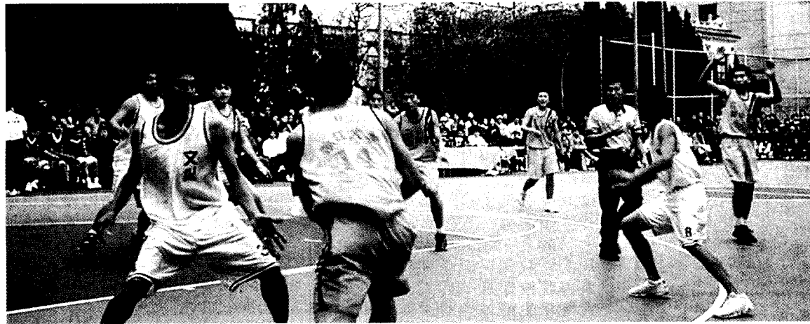
浙江大學與文大的籃球賽爭霸戰在文大舉行，文大小贏浙大七分。

浙江大教育學院體育學系成立於1952年，是中國大陸最早創建的體育院系之一，而浙大體育學系的總體實力，在全中國高等師範院校體育學系中，也名列前五強之列。相較於浙大，文大的體育系創立自民國五十二年，40年的歷程下來，年年國手輩出，而在每年的大專盃中往往表現優異，戰果輝煌。