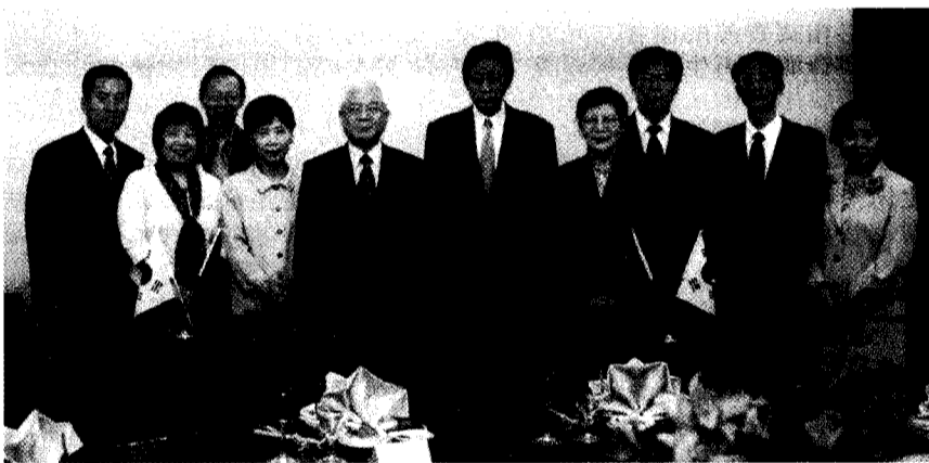
文大與仁川大學進行姊妹校續約後,兩校師長合影留念。

流,獲韓國大統領頒發「韓文發展有功者獎」,許多文大的韓國姊妹校紛紛致賀,並積極與文大交流;仁川大學也基於與文大多年前的姊妹校關係,這次來台續約只希望兩校能有更密切的學術合作關係。