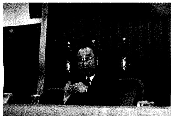
韓國姊妹校湖南大學校長尹亨燮，特地為文大師生演講「大學發展的條件」。

【記者徐淑燮報導】文大韓國姊妹校湖南大學校長尹亨燮，於文大四十一週年校慶的上午，獲頒文大名譽法學博士學位，當天下午隨即應邀在曉峰紀念館國際會議廳，為文大師生進行一場名為「大學發展的條件」的演說。