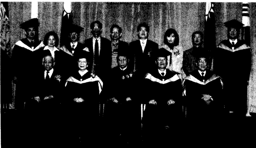
來自韓國湖南大學的友人、總統府資政趙自齊（前左一）等與文大張董事長、林彩梅校長等師長合影。

5.九十學年度專書獎；6.九十學年度藝術及設計創作獎；7.九十學年度專利獎；8.連續三年(88.89.90學年度)獲得「國科會專題研究計畫經費補助獎」；9.九十一學年度體育成就獎；10.九十學年度獲得「建教合作案研究計畫經費補助總金額達三百萬以上獎」；11.轉頒國科會九十年研究創作獎；12.頒發推廣國際學術交流有功獎；13.頒發協辦2002年世界大學棒球名校邀請賽有功者；14.頒發藝術學院籌畫慶祝創校四十週年紀念歌舞劇「鵲橋」公演有功獎；15.轉頒董氏基金會社會公益獎。16.頒發九十一學年度美化安全比賽前三名獎。