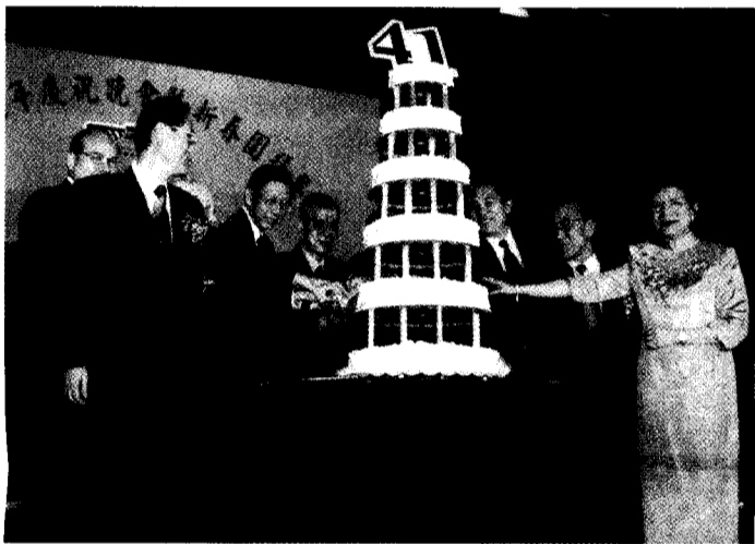
校慶晚會中，文大張董事長、諸位董事、林校長，以及日韓貴賓共切文大41歲生日蛋糕。

附帶一提的是，與曾后希水墨畫展同時展出的，還有華岡博物館館藏的多位書畫大家溥心畬、孫多慈、季康、梁中銘、孫家勤、唐石霞等人物水墨畫。