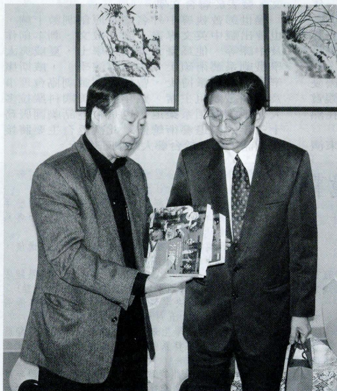
楊世彭教授（左）與張董事長交換戲劇教育意見。

【記者吳玟健報導】華人莎士比亞戲劇權威、美國科羅拉多大學戲劇舞蹈系前主任的楊世彭教授於 3 月 7 日上午參訪文大，並於下午在敬業堂為戲劇系同學進行演說。與文大戲劇系與國劇系進行意見交流時，楊世彭也表示，對於文大不久後即將興建的藝術大樓，他會全力支持並提供相關意見與諮詢。