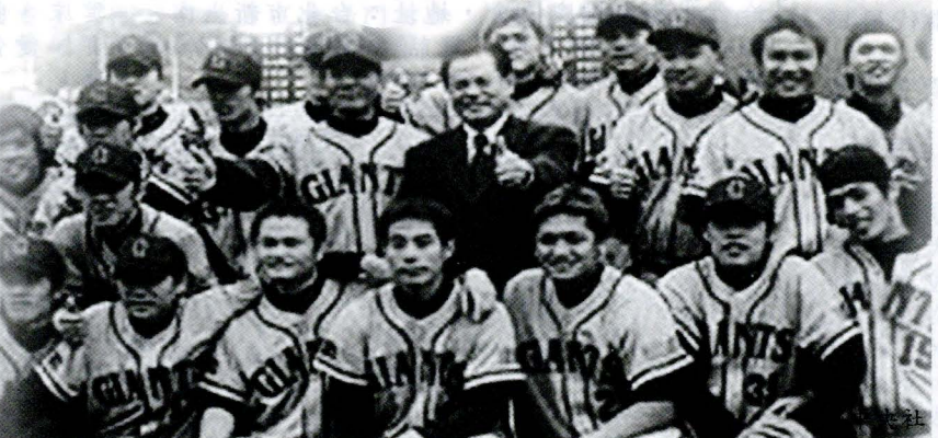
文大美孚巨人棒球隊拿下協會盃全國成棒賽冠軍，獲得棒協理事長彭誠浩肯定。

2002 年協會盃全國成棒賽自去年起開賽，一共有美孚巨人、臺北市立體育學院、大漢技術學院、臺灣電力公司、吳鳳技術學院、國家儲訓隊、中興保全、臺灣啤酒公司、中國商業信託銀行、合作金庫銀行與富邦公牛隊十一隊參加，經過三十多場比賽在 1 月 12 日比賽結束。