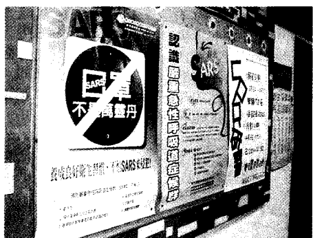
SARS來勢洶，文大總務處、衛生保健組也配合衛生署進行宣傳工作。

【記者李桂媚報導】SARS 被列為第四類法定傳染病，目前正流行中，文大特別提醒同學，應多運動、多洗手、均衡飲食提昇免疫力，避免感染。為了防治疫情擴大，衛生署進行一連串的宣传，大家除了戴上口罩外，也避免到疫區觀光，進行根本的防治，同時若發現相關症狀也應儘速就醫。