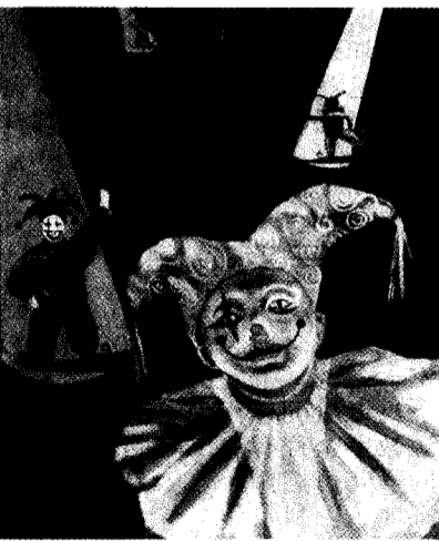
美術系三人聯展讓觀者獲得前所未有的視覺享受。

史克里西賽為題發表學術論文。此場音樂會特別優惠文大的音樂愛好者，票價一律一百元，有意參加者請洽音樂系西樂辦公室，電話：02-2861-1714。