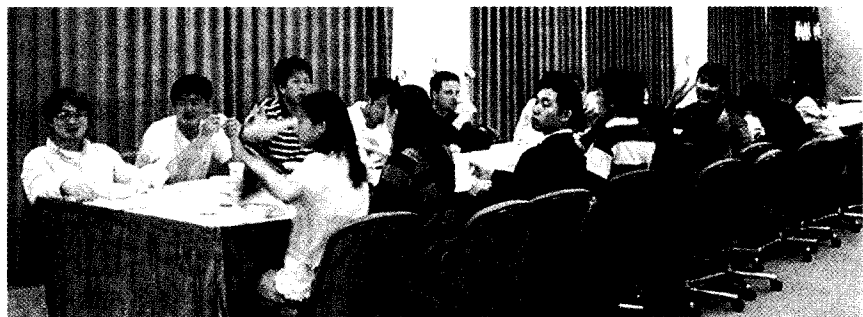
文大舉辦交換生座談會，關心他們在台生活安全。

座談會之後，之前沒見過面的交換生，認識到了彼此，又有的進一步交友的空間，除了互相瞭解語言學習的過程，也在生活方面交換許多經驗，也更加肯定了文大對於交換生的安排，以及來文大能學到許多、認識許多的信心。相信文大熱情的同學們，以及台灣親切的所有鄉親，都做到了禮儀之邦的本分，讓來自世界各國的朋友們滿載而歸。