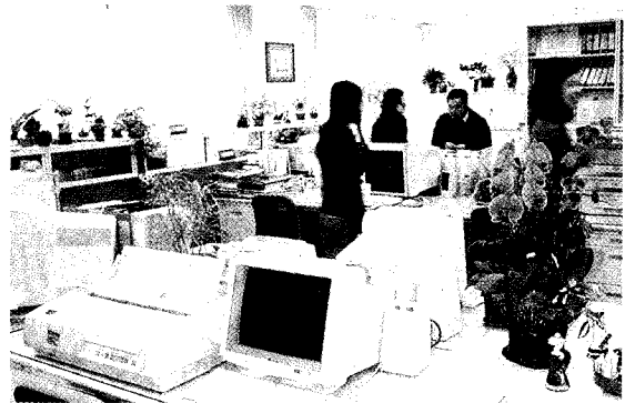
人事室辦公空間綠意盎然、美輪美奐，堪為整潔表率。

造成逃生通道阻礙的物件，使用危險電器如電鍋、微波爐、冰箱、插置過多延長線等，單項每樣扣5分）佔30%、佈告欄佔10%。