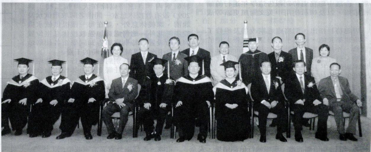
金正幸校長獲頒名譽博士學位後，與文大張董事長、林彩梅校長等合影。

【本報訊】在國際體壇具有舉足輕重地位的韓國龍仁大學校長金正幸日前來台，於 4 月 18 日獲中國文化大學頒贈名譽理學博士學位；同時基於中韓友誼，當天上午陳水扁總統也親自接見金正幸，一同討論中韓文化交流未來的發展。