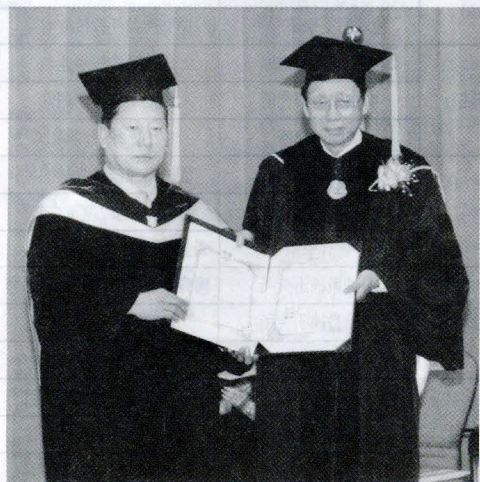
張鏡湖董事長親授名譽博士學位證書給龍仁大學金正幸校長。