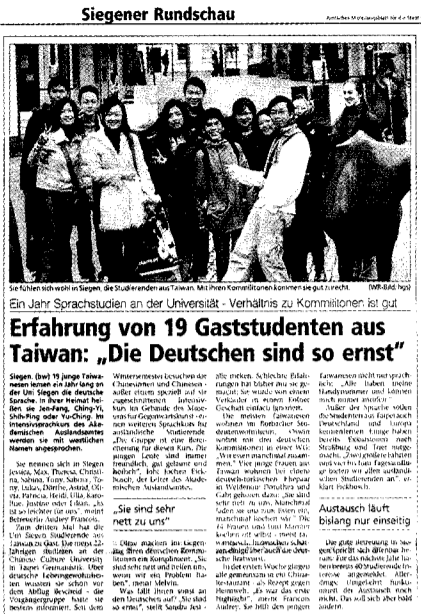
Ein Jahr Sprachstudien an der Universität - Verhältnis zu Kommilitonen ist gut Erfahrung von 19 Gaststudenten aus Taiwan: „Die Deutschen sind so ernst“