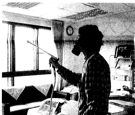
文大委請消毒公司進行校園全面消毒工作。

總務處也指出，文大於國內 SARS 爆發流行初期，即通知學術、行政單位大力宣導關於 SARS 防範之道，例如勤洗手、增加抵抗力、上課（班）開窗戶。也於洗手台放置肥皂和洗手乳，提供師生勤洗手。由於國內疫情不斷擴大，總務處也緊急購買酒精棉球，消毒借出後歸還的麥克風。同時要求大雅餐廳打烊時全面以漂白水稀釋拖地清潔。校車也以稀釋漂白水擦拭車內扶手及門框。不論搭乘校車或電梯也都宣導禁語，避免飛沫傳染。