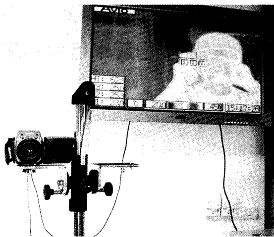
「紅外線遙測溫度熱像分析儀」運用在體溫測量快速有效。

資訊中心於兩年前即已採購此設備，當時主要為了進行有關「數位地球」研究時，作影像分析，尋找熱點使用。此次首度以人體為主進行偵測，技術上只要將溫度範圍設定在十至五十度間即可；該儀器偵測較低溫會呈現藍綠等色，超過 36.5 度即出現橘紅等色，在儀表上清楚明白，且能以三點座標直接鎖定人體區域，以數值表現體溫，在使用上十分簡易。