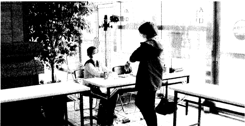
文大全面實施人員進入館樓量測體溫，體溫正常者蓋上戳章，並可憑藉自由進出所有館樓。

若無須送醫檢查，或經醫院檢查非 SARS 病例時，則由醫師給藥及 7 天觀察病假，使返家休養，並要求其與他人接觸時需佩戴口罩；教官也登錄學生電話隨時保持聯絡與關懷，同時告知所系主任、班導師、助教及家長。衛生署疾病管制局局長蘇益仁稍早指出，根據全球七千個 SARS 病例的發病症狀顯示，SARS 感染者初期還沒發燒時並無感染力，甚至在發燒前 12 至 24 小時也無傳染力。他強調，只要正確測量體溫，不要讓發燒者進入公共場所，即可有效預防 SARS 感染。知名醫學期刊「刺蝟針」也透過 75 名 SARS 患者的臨床症狀發現，SARS 病人在感染後發病的前 3 天至 5 天會出現高燒，但 4 至 6 天會出現可怕的退燒情形，這個退燒時期恐怕是造成防疫空窗的最危險時期，因此找出發病前 3 至 5 天這個黃金時期，刻不容緩。