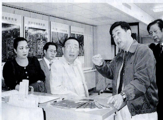
在張董事長陪同下，資深外交官陸以正參觀文大數位地球中心，從太空看天下。

【記者黃盈淳報導】我國資深外交官陸以正與文大東方語文學系韓文組第一屆校友于陵江於 4 月 8 日參訪文大。在董事長張鏡湖的陪同下，陸以正及于陵江參觀文大數位地球資訊中心，透過文大最新的衛星影像看全世界，並經由這項科技了解國際情勢的若干問題，由於陸以正擔任外交工作甚久，因此對數位地球科技在外交上的運用感到興致盎然。