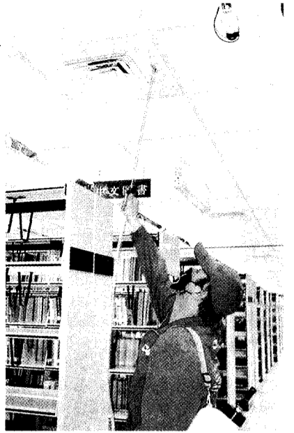
日前文大委託廠商以光觸媒消毒劑噴灑館樓空調系統進出風口。

多宣稱能預防 SARS 的口罩。以 N95 口罩來說，可以過濾 95% 大於 0.35 微米的粒子，能夠有效過濾粉塵，卻阻止不了 SARS 病毒的通過。