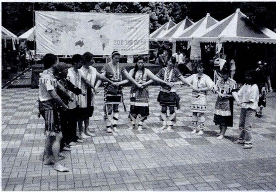
社團聯合招新活動期間，中午與晚間都有各社團的表演活動。

社團是大學必修的三大學分之一，因此在大學生活中扮演著重要角色與調劑品，同學可以在參與社團活動中，認識新朋友及學習新經驗，讓生活變得更美好豐富。