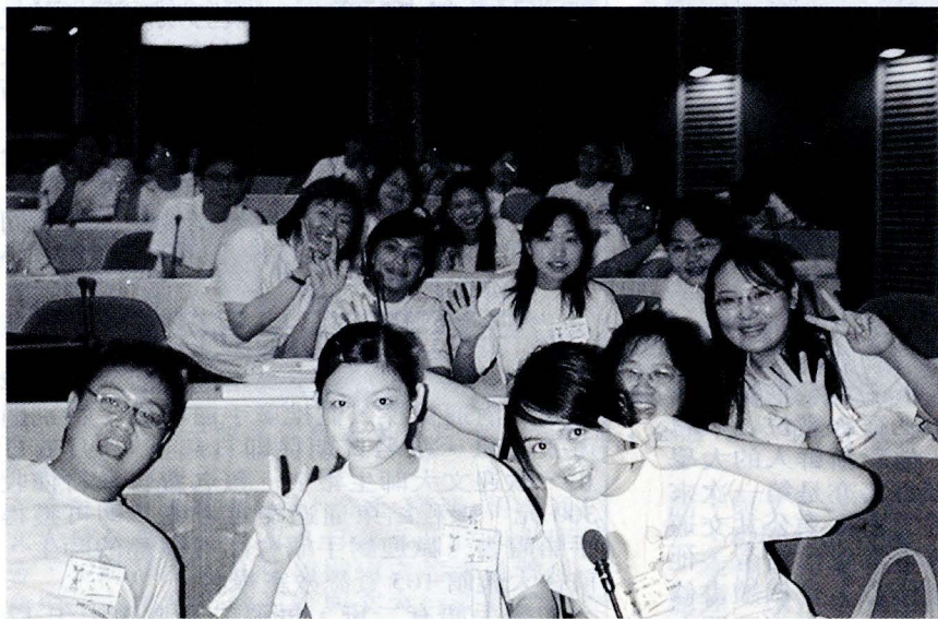
社團負責人歷練兩梯次六天的研習後，對未來社團的經營更有信心。