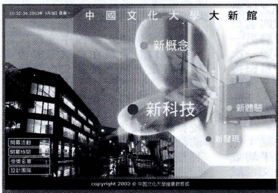
大新館經整修後，展現出人文與科技結合的建築新風貌。

9 月 19 日的研討會活動將於文大博愛校區大新館舉行，除了由李校長主持會議外，教育部高等教育司長黃宏斌也特別蒞臨指導，並擔任主持人。內容主要有「報告事項提案討論」、「經營管理實務觀摩分享」，以及文大校園教學設施參觀活動。