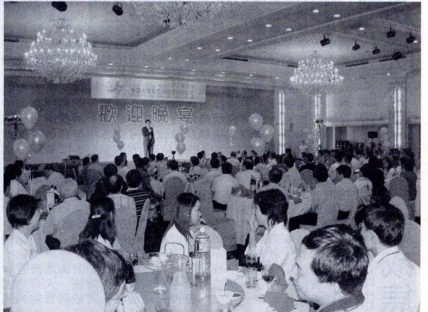
安排在環亞飯店的全國大學校院經營管理研討會歡迎晚宴，讓來自全國大學校院的與會者賓主盡歡。