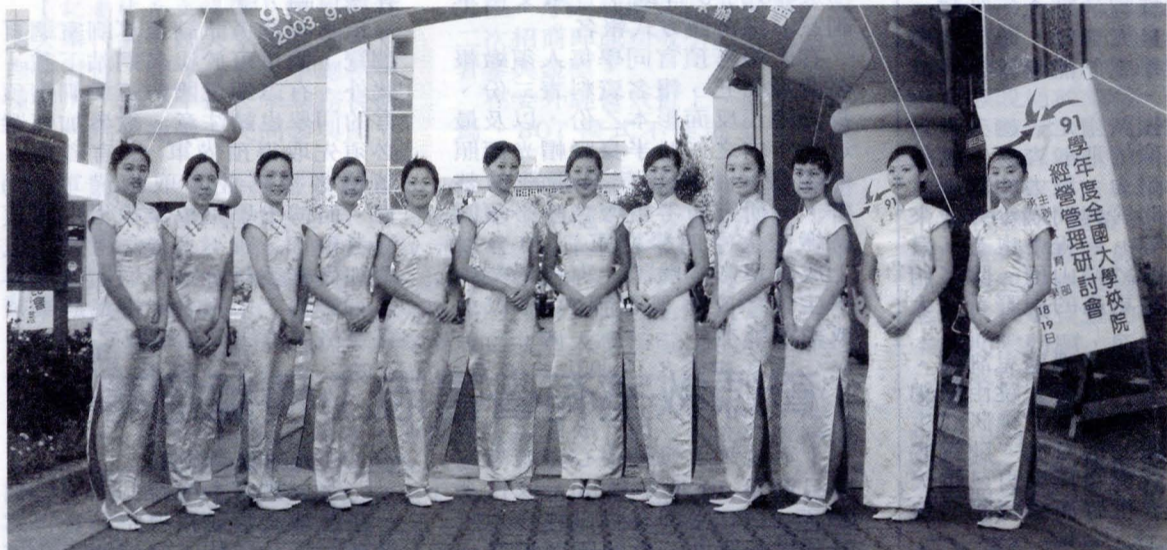
全國大學經營管理研討會特別安排公關室不久前才組織成軍的「華岡親善團」，擔任禮賓人員。

值得一提的是，這些藝術展演提昇了研討會的人文水準，穿梭會場提供即時服務的禮賓人員，更提高了這次會議的規格。由文大公關室不久前才組織成軍的「華岡親善團」有男有女，許多來自各大學的主任秘書、總務長抵達會場門口馬上獲得專人服務，整齊劃一的制服與國際標準的儀態，讓他們猶如置身國際級會議現場，從而體驗了一場前所未有的研討會經歷。