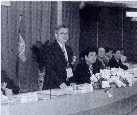
文大承辦九十一學年度全國大學校院經營管理研討會，教育部高教司司長黃宏斌蒞臨主持。