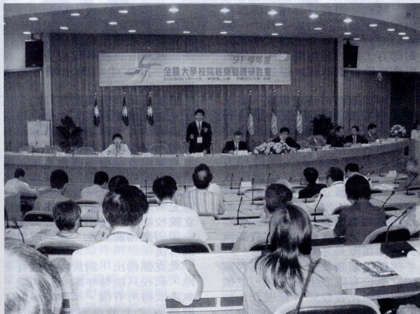
今年文大承辦的全國大學校院經營管理研討會，與會人數近兩百人，為歷年來人數最多的一次。

值得一提的是，此次研討會還安排了一系列的藝文展演活動，例如美術系學生聯展的「肆度空間」、華岡博物館典藏的台灣民俗文物展、中國歷代古陶瓷展、吳承硯教授紀念畫展、國樂系的華岡絲竹樂團室內音樂會、西樂系的鋼琴獨奏，以及社團的聯合表演等，讓貴賓們能夠於會議閒暇時間內自由參觀欣賞，感受不一樣的藝文活動，而研討會後的晚宴，還另外安排了藝術學院與國術系同學，為貴賓進行舞蹈、武術、音樂等多項表演活動。