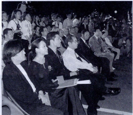
大新館啓用揭幕典禮頒發「文化創意獎」給傑出校友，多位校友蒞臨受獎，也見證母校的成長。

【本報訊】集數位科技與人性化服務於一身的中國文化大學博愛校區大新館，於 9 月 17 日晚間 7 點正式揭幕啓用，代表蛻變與新生的蝴蝶，以藝術形式裝置在大樓外牆上，讓人耳目一新。開幕當天，邀請到獲得「創意傑出校友獎」的 9 位中國文化大學校友，與張鏡湖董事長、諸位董事、李天任校長等共同為大新館舉行揭幕啓用儀式，象徵大新館開展新生與蛻變的生命。