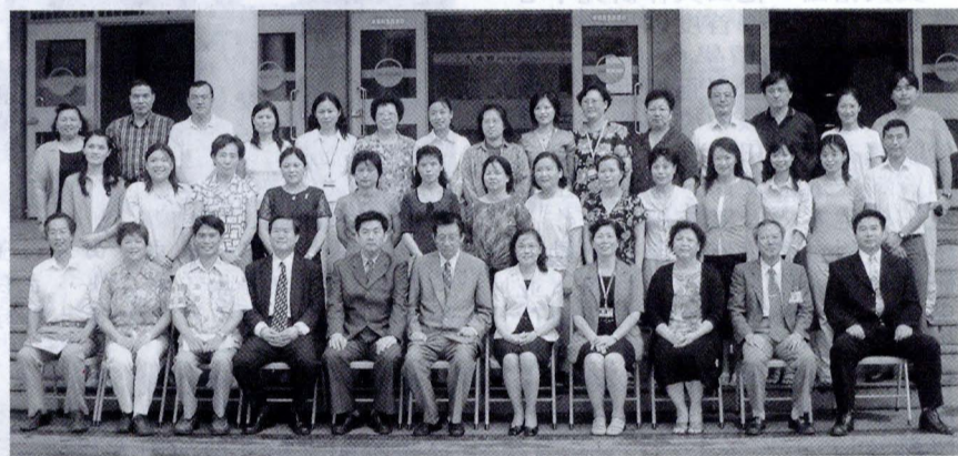
學務處同仁參加「教訓輔三合一學生事務專業知能研討會」，提昇專業能力。

【記者蔡玉芳報導】與學生關係密切的學生事務處同仁8月7日齊聚一堂，參加「教訓輔三合一學生事務專業知能研討會」，研習訓輔工作的專業知能，這群學生們最好的朋友，不但可以懂得E世代的大學生，還要迎接F世代，更期許未來能搞懂吞世代，他們要給大學生一個健康有活力的學習環境。連續三天的研討會，參加人員共計70人。