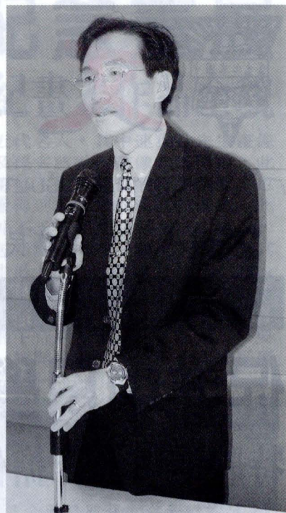
王學務長以資訊的提供、服務的提供，以及課外活動的推廣，做為學務工作三大主軸。

王學務長是文大的校友，畢業於文大政治系，又繼續唸文大政治研究所的國際關係組，前後共六年，他對文大母校有著一份濃厚的感情。從英國攻讀博士學位回來後便投入教學工作，在文大先後擔任過政治系助理教授、副教授；他同時也是民間社團「中國國際法學會」副秘書長，在學術領域有非常多的經驗與成就，如今又身兼學務長一職，他表示，他將全力投入、努力學習，多方接觸並了解學生的需求，以提