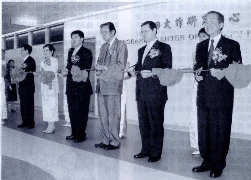
池田大作研究中心成立，由文大董事長張鏡湖、校長李天任、該中心名譽主任池田博正（右二）、主任林彩梅、總務長唐彥博、台灣創價學會理事長林釗（右一）等共同剪綵。

文大指出，池田大作研究中心將是台灣的大學首度以學術的角度，對國際創價學會（SGI）會長池田大作的思想行誼進行深入研究與推廣。該中心主要任務在於收藏有關池田大作先生之書刊和資料並成立文庫、翻譯和出版池田先生本人及其有關之著作、舉辦研討會和講座等學術活動、研究池田大作之思想及行誼，並與國內外的學術機構和有關單位進行學術交流。為此池田大作也特別提供他的著作兩套 240 本，由該中心成立文庫收藏，並進行研究。