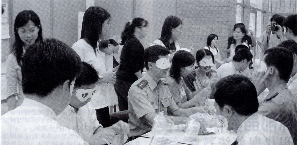
師生矇眼包餃子，體驗視障生的生活世界。

別出心裁的比賽共有五組人馬參賽，文大校長李天任也捲起袖子，與文大師生「蝦攪和」，究竟3分鐘內大家「蝦攪和」的技巧如何？從一顆顆奇形怪狀的餃子中可見端倪。