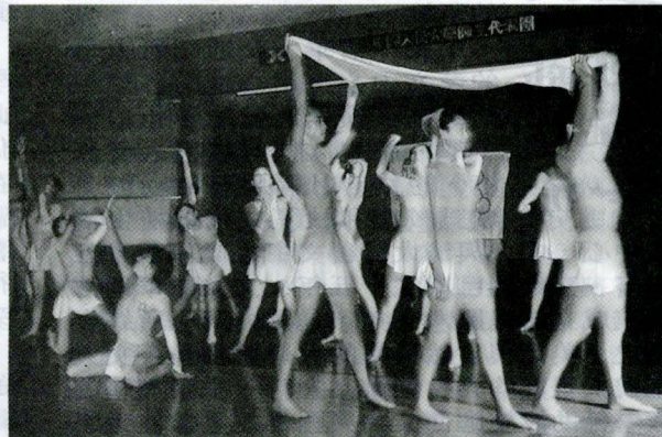
中國人民大學表演藝術團來文大交流舞藝，展現專業舞蹈技藝。

文大舞蹈系則演出不久前才獲獎的《爭艷》舞碼，這支舞係結合國劇的音樂、身段，表現出舞者間爭奇鬥艷的姿態，忌妒、憤怒、得意、失落都清楚顯現在舞者臉上，融合了舊傳統與創新，展現了新意象。此外，熱舞社所表演的 Hip-Hop 與 New-Jazz 也讓表演藝術團的同學印象深刻。土風舞社、國標舞社也展現出多國舞蹈風情。