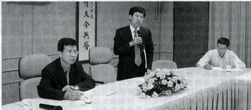
在總務處積極奔走下，特別邀約台北市議員潘懷宗與自來水處官員來本校，共同協調水荒解決之道。

總務處也說明水荒短期應變措施，總務處指出，今年 9 月起，本校在沒有接獲預警情況下，發現自來水供應不足，旋即採取緊急應變措施。9 月 9 日起，開始視自來水進水狀況，輪流由曉峰館 600 噸或大成館 800 噸蓄水池供水，並改由較低處之曉峰館蓄水池主要供水；9 月 23 日將曉峰館蓄水池制水閥改為手動，迅速將華岡路水量撥入該池，並安排人員 24 小時隨時補充不足水