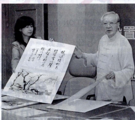
嶺南畫派大師歐豪年介紹捐給本校的畫作。

【記者莊之淵報導】繼中央研究院成立嶺南美術館後，台灣嶺南畫派重鎮中國文化大學也成立歐豪年美術中心，共同推廣嶺南畫派作品。台灣嶺南畫派大師也是文大美術系教授的歐豪年特別捐出百幅具有代表性作品，範圍涵括他 1957 年早期出道，到 2003 年近期的作品，完整展現一代嶺南畫派大師的各時期畫風，讓文大歐豪年美術中心成為首座以單一嶺南畫派作家作品典藏為主的美術研究機構。值得一提的，是具有數位資訊專業背景的文大新校長李天任，特別指出該中心的未來發展重點，即是數位典藏計畫，甚至將所有典藏數位化後，轉成動畫，將國畫進行更現代化的推廣。