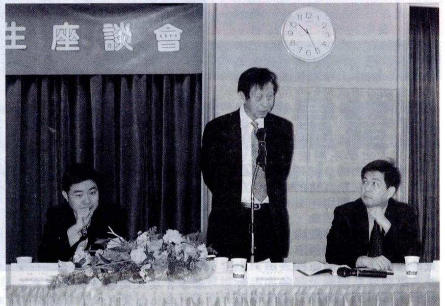
文大董事長張鏡湖於交換生座談會中，期許每位外籍生來文大，除了將中文學好，也能參加社團活動，並多認識一些臺灣的朋友。

韓國。不過他即將於明年 1 月的時候完成文大的學業回到韓國。他說，雖然想家但想到真的要離開臺灣，還是有點捨不得。