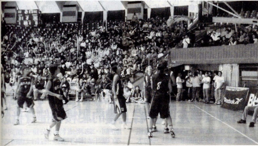
文大與輔大的籃球明星賽在輔大中美堂打得相當火熱，觀眾參與的情況幾可媲美亞錦球賽盛況。

今明兩日比賽場次如下：12 月 8 日下午 1 時，於北市天母棒球場舉行 G16 準決賽；5 時為 G17 準決賽。12 月 9 日則為中午 12 時於北市天母棒球場舉行 G18 決賽；5 時為 G19 決賽 G16 勝隊 Vs. G17 勝隊；8 時半則為閉幕暨頒獎典禮及晚宴。