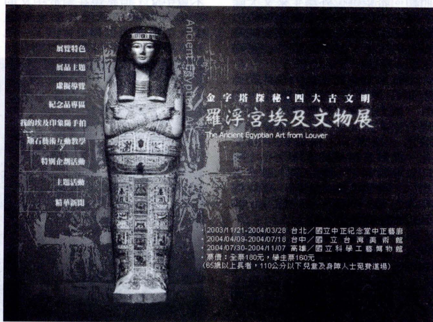
羅浮宮埃及文物展世界四大古文明之一「金字塔探秘」11月21日起在中正紀念堂中正藝廊揭幕。展期到明年3月28日。

這次埃及展共計展出 625 組展品，展覽分為 4 大主題：「破解古埃及—法國與埃及考古」、「埃及文明搖籃—尼羅河及其生態」、「埃及與法老王—古埃及