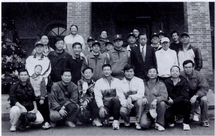
董事長張鏡湖到場為文大加油並合影留念。

爬樓梯是一項既省錢又可減少熱量的好運動。學校方面大力推廣，讓同學在身上的發展都能處於均衡的狀態，希望同學也能共襄盛舉。平日若不喜歡運動的同學，也能藉著爬樓梯的小動作，達到相同的效果。