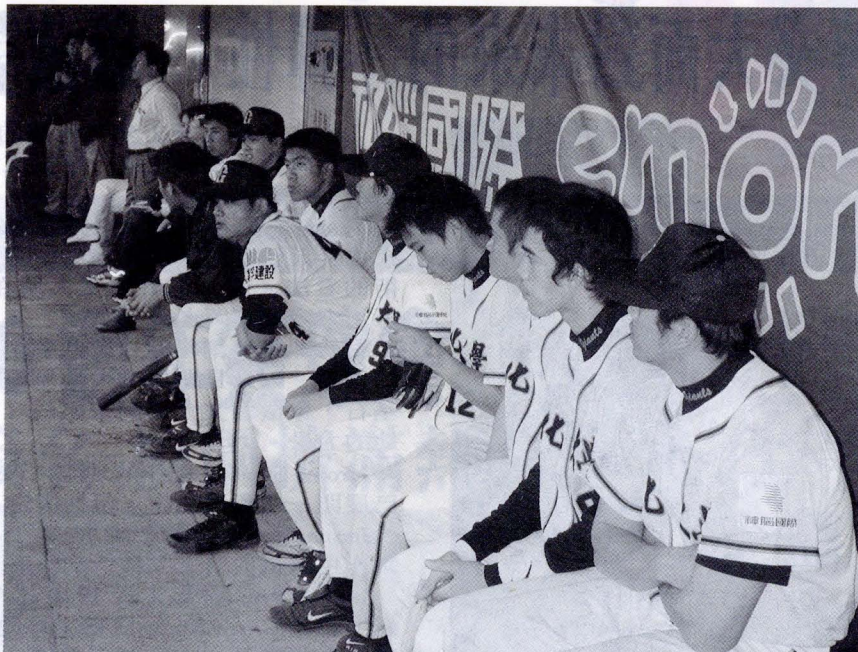
文大在一次又一次的賽程中，逐漸的成長與茁壯，成為國內知名的球隊。

文大棒球隊成立後，相繼得到國內知名企業公司贊助，成立了建教合作棒球隊。如民國 65 年至 67 年與林口竹林山寺；67 年至 77 年與味全公司；77 年至 80 年與美孚建設；81 至 85 年與聲寶公司；86 年迄今與美孚建設合作，在這些企業的贊助下為文大提供了充分的資源，使文大棒球隊得以在國內甲組成棒及大專甲組各項比賽中奪取獎牌。如一般人耳熟能詳的自立杯棒球錦標賽、大專棒球聯賽、中華杯成棒錦標賽、國慶杯成棒錦標賽、中