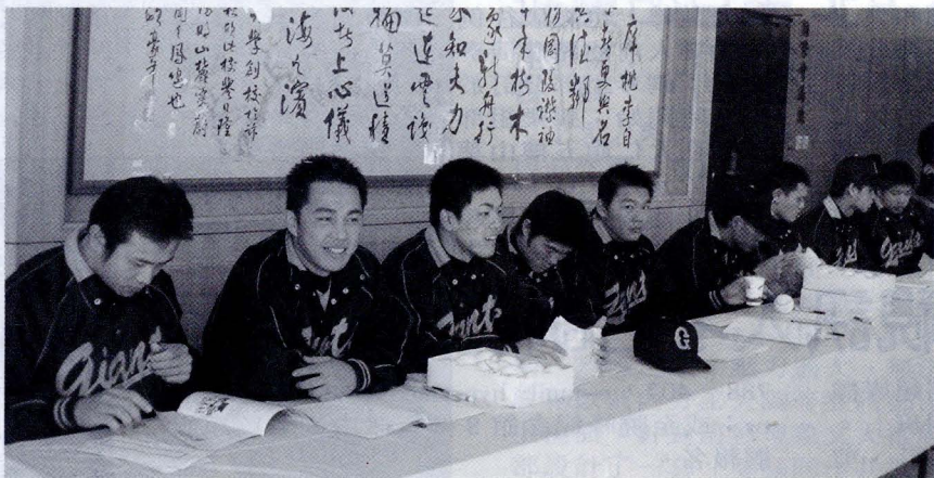
文大特於 22 日「棒球隊 40 週年隊慶嘉年華」開始前辦一場「簽球會」。

在曉峰紀念館看完文大棒球隊 40 週年的歷史紀錄後，許多文大同學早已聞風而來，準備好球要給這些心目中的棒球明星簽名，就連文大校長李天任也沒有缺席。冗長的隊伍把整個大恩川堂繞了好幾圈，夾雜著同學們此起彼