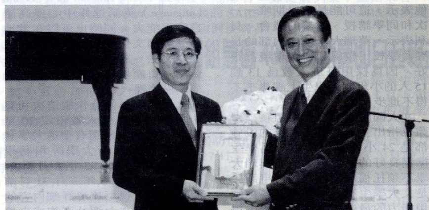
文大大新館參與「2003 都市變臉 臺北夏宴換妝」徵選活動，獲「私有建築物、開放空間篇」金獎。