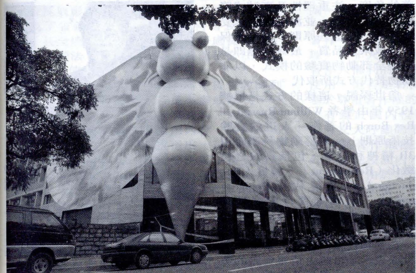
大新館變臉，呈現都市新風貌。

爲了推動臺北地區環境改造計畫，臺北市都市發展局自 2001 年起，連續三年舉辦都市變臉有獎徵選活動。希望藉著活動的宣導，鼓勵市民主動改善、維護建築物外觀，讓城市容貌，不斷因爲注入新血，而顯得整潔與充滿朝氣。