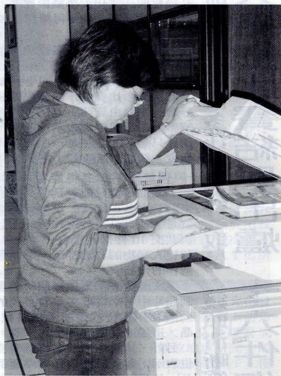
依著作權法第 46 條規定，學校和老師都可以在合理範圍內，影印書籍做為上課的教材。

新著作權法已於 92 年 7 月 11 日開始生效，修正重點包括：將「將暫時性重製」明列於「重製」定義中、增訂公開傳輸權、散布權、公開演出報酬請求權、「權利管理電子資訊」保護規定、修正合理使用規定及調整侵權行為之刑事責任等。經濟部智慧財產局已將相關資訊置於網站上，其內容包括上述新增項目外，還有網路交換軟體、E-Mail、搜尋引擎及燒錄光碟等同學常遇之