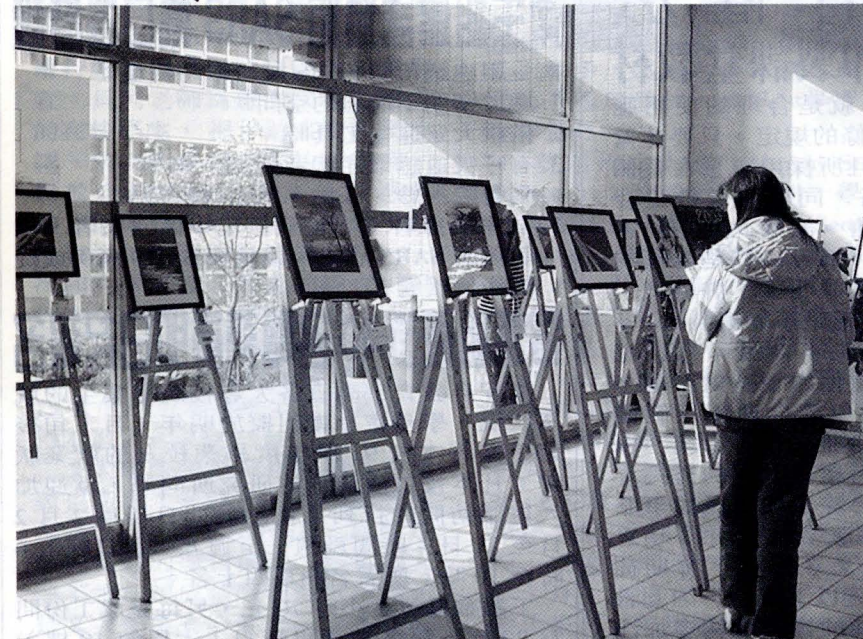
於 25 日至 30 日在大恩館 2 樓川堂展出攝影比賽成果展，吸引了許多同學駐足觀賞。

「攝影就是要多拍，才會有所成長」這是得獎同學一致的心得。攝影技巧無從研究，只能多看別人的作品做比較，學習別人的表現方法；然後自己多拍攝、多揣摩。