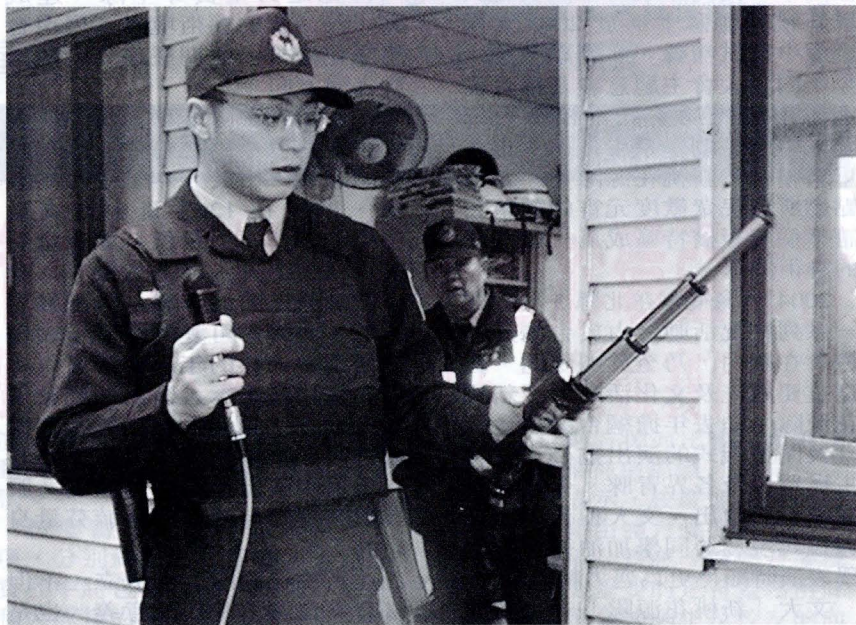
為了強化校警人身安全，文大緊急採購防彈背心、伸縮電擊棒、安全頭盔等供校警執勤時穿著及佩帶。