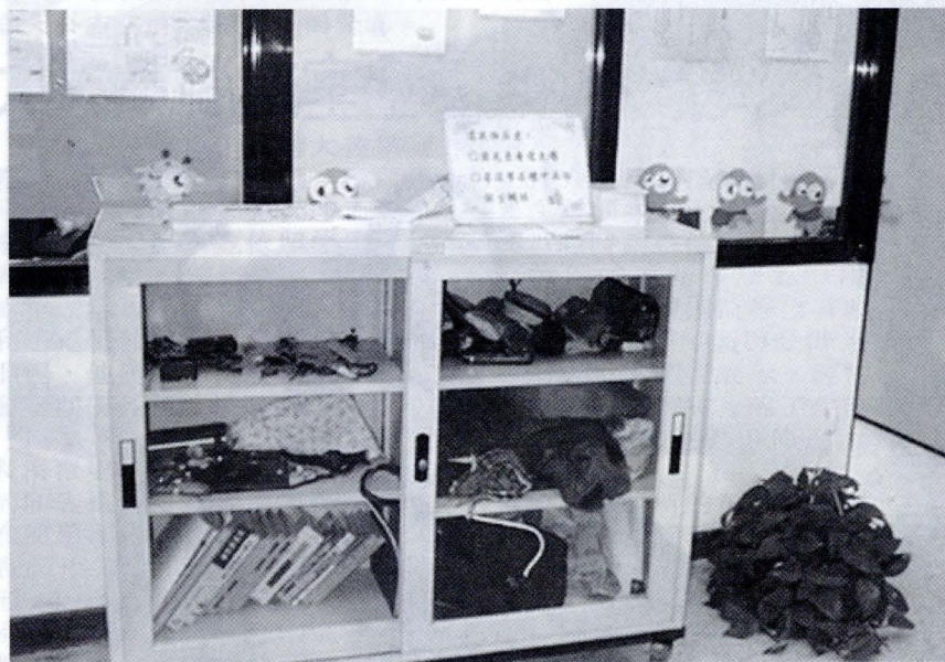
同學送至生輔組等待認領物，大多為皮夾、手機；也少不了鑰匙、鉛筆盒、眼鏡、禦寒物等。

除了娛樂功能之外，也有許多老師因為上課需要，向圖書館推薦教學用影片。不管是DVD、VCD、CD、錄影帶、卡帶，還是幻燈片，李主任說，只要是和多媒體有關的，圖書館都歡迎大家來推薦。至於，決定添購的標準，影片除了一定要有公播版之外，李主任表示，採編組平常就會統計推薦人數的累計量，再依據內容是否符合大學生觀賞來做決定。