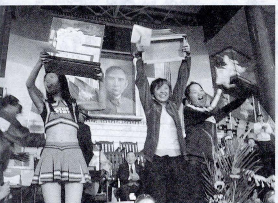
啦啦隊精湛演出，舞蹈、大傳、觀光、國術系一舉奪下特優獎！

此次晚會校園的學生記者幾乎是全體出動。攝影記者透過他們的鏡頭將晚會籠罩在鎂光燈的氛圍下，文字記者透過巧筆，將得獎人的心情描繪的活靈活現。尤其隸屬於公關室的華岡超媒體《文大校訊》、《華夏導報》；新聞系的《電視組》、《廣播組》、《攝影報》、《文化一周》平面、電子媒體幾乎全部出動。晚會上新傳學院的記者們，也趁著採訪之餘，舉起酒杯，向連日來默默為其付出的老師們敬酒，場面溫馨感人。