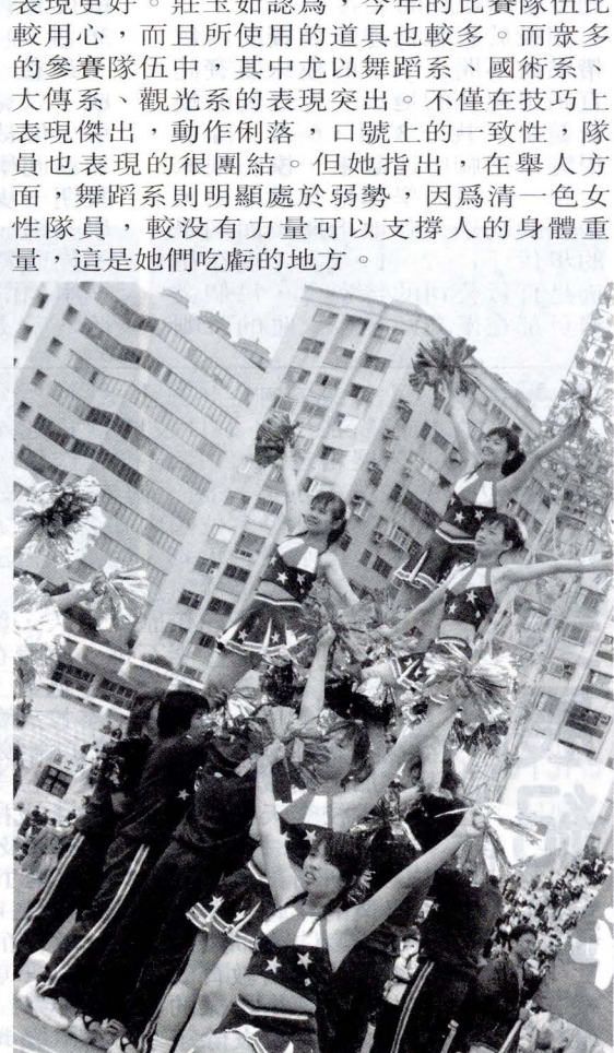
國貿系以其動作俐落、口號上的一致性，奪得優等獎。