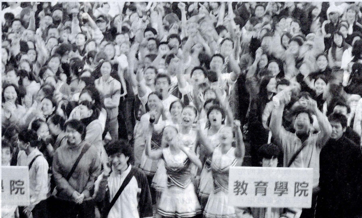
文大 42 週年校慶運動會，一天下來，在場的華岡人人氣不減，給予這次大會高度的肯定呼聲，充分展現「活力文化，舞動創新」的精神。

華岡藝校在此次大會中亦受邀參加，表演充滿了濃濃的藝術特質。不論是音樂或舞蹈的表演，都是特別為了文大校慶所精心策劃。不但有氣勢磅礴的旗舞，也有柔美的舞蹈及逗趣的笑料，使得文大的運動會增添不