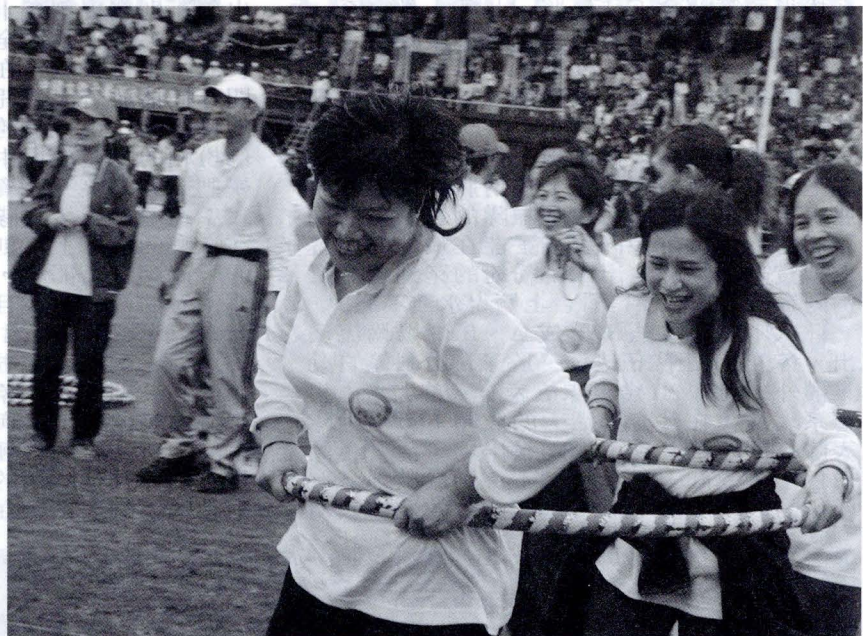
在比賽過程中，有的教職員因為用力過度，還把呼拉圈弄斷，搞得全場笑聲不斷。