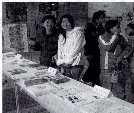
「校園安全」宣導活動，包含交通安全、校內外住宿生安全、防火、防盜、春暉反毒、衛教安全等人為或天然災害的宣導活動。