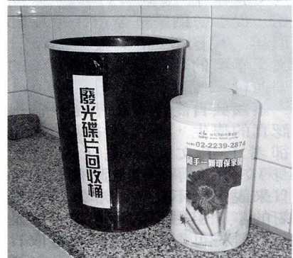
總務處在大恩、大雅、大慈、大倫、大莊館分別增設廢棄光碟回收桶，希望文大師生共同響應。