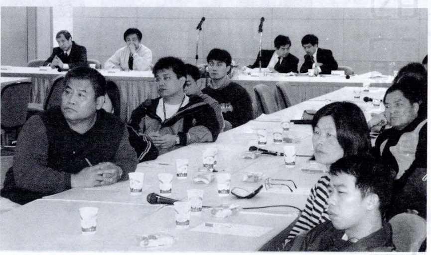
體育系老師熱烈參與「新建工程分組討論會議-各體育空間功能說明會」

外，陳錦賜院長也建議，將創辦人偉大的行誼事跡及其著作整理成小冊子，讓學生從中學習及了解創辦人辦校的理念及精神。 美術系系主任李福臻表示，自己是直接受到張創辦人的領導。當時李主任曾擔任《美哉中華》書籍的主編，透過張創辦人的幫助下，使得《美哉中華》順利發行。她並且不好意思的說，自己所走的路線和張創辦人一樣，張創辦人以前也曾擔任過編輯，在商務印書館任職了4年，但是自己卻沒有像張創辦人那樣偉大。 景觀系系主任郭瓊瑩則表示，有些師長並非文大畢業，對於創辦人偉大的行誼比較不清楚，因此她建議學校是否可以將創辦人行誼以影像的方式呈現，這樣不但可以方便學生了解，也較具有啟發性。