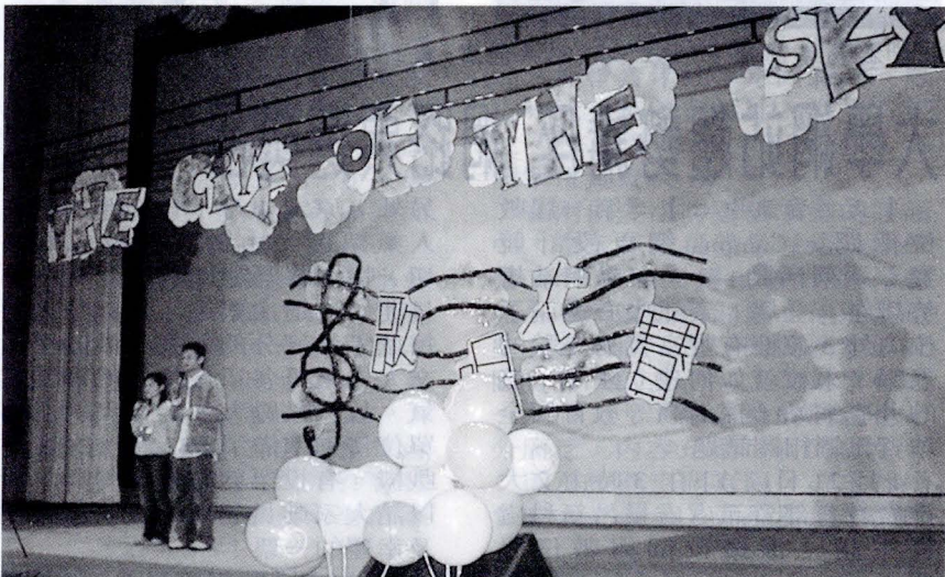
法商社科等學院歌手參與天空之成歌唱爭霸戰。

社長曾振圓說，詞曲創作社創立初期，樂風偏向於校園民歌的輕快曲風，和民謠的清新、自然，此一時期以流行歌手林隆璇為代表。近年來由於音樂風氣轉變，以及社員的推廣和回響，使曲風改為偏向搖滾樂，但基本理念強調創作、思考音樂而不抄襲，卻從未更改。