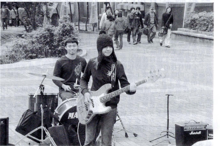
詞曲創作社的一場搖滾演奏會，讓百花池畔一時間喧鬧起來。