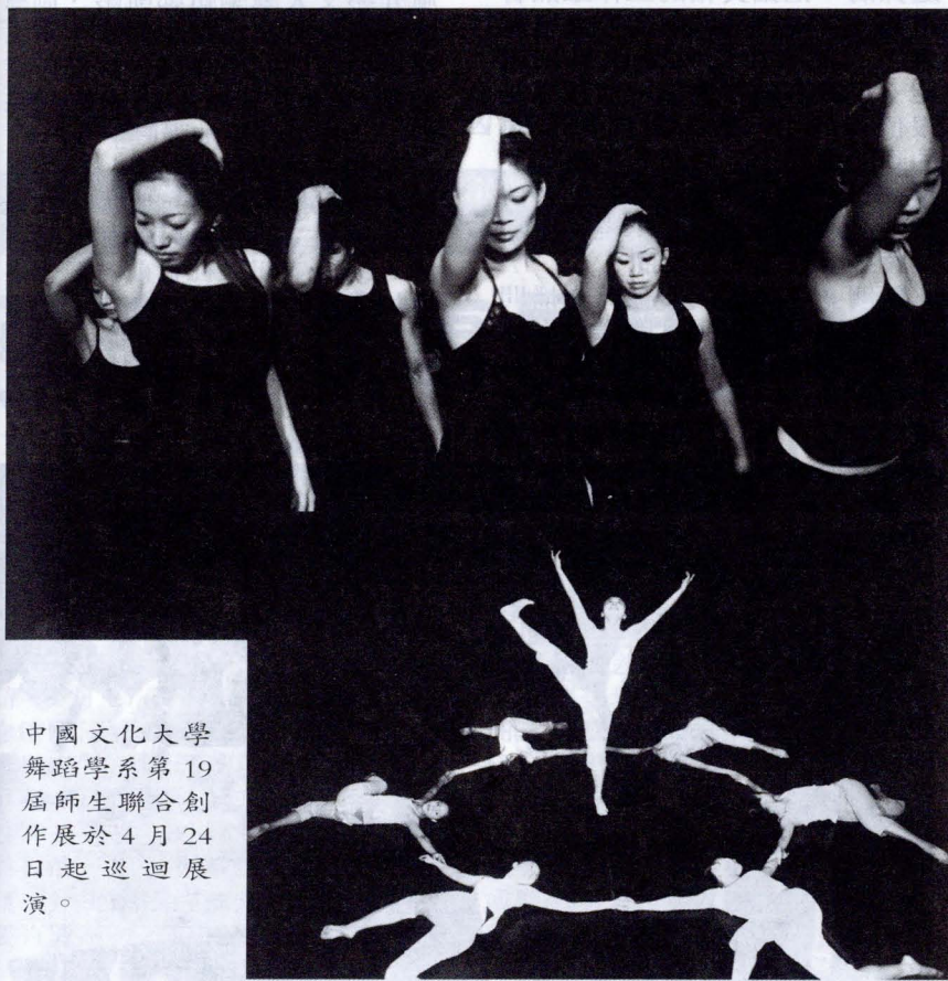
中國文化大學舞蹈學系第 19 屆師生聯合創作展於 4 月 24 日起巡迴展演。

者的創作精神而衍生其特殊表達涵意。舞者人數、道具與服裝的組成與態勢也各有特點。有描寫一群活潑少女在河岸邊高興的在跳著舞跟著輕快音樂舞動起來的「水漾情」；表現秋冬替換之際，因花朵的綻落而譜出一幅美麗畫景的「芳菲綻影」；或是訴說古時候女人沉重與無奈宿命、過程中帶著詭譎氣氛的「紅顏淚」等。每一支舞都是舞蹈系畢業班同學與指導老師們共同致力激發而出的精華結晶。