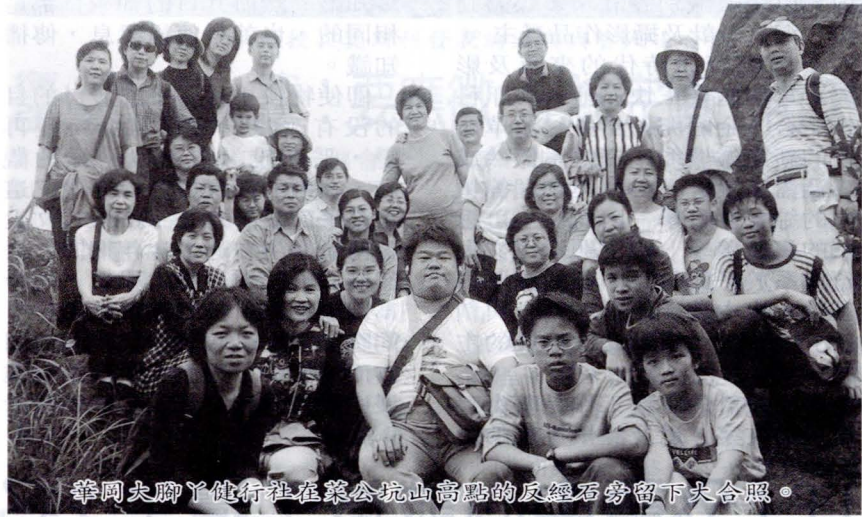
華岡大腳丫健行社在菜公坑山高點的反經石旁留下大合照。

回程重踏來時路，熟悉而愉悅，比預期要早到達終點。陽明山總站解散前還搭了一趟霸王車，算是佔點小便宜，為整個活動圈下歡喜的句點。