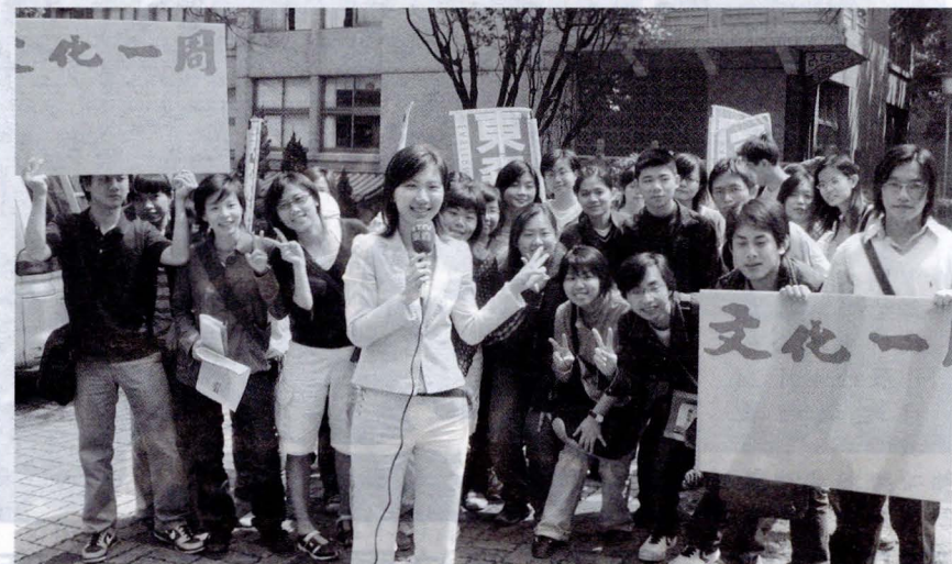
東森新聞來文大進行校園徵才活動，文大同學紛紛前往試鏡。