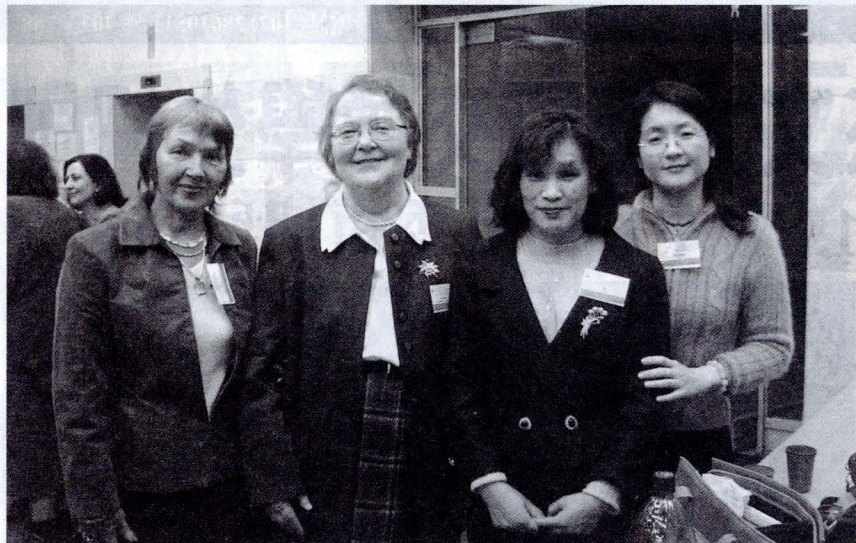
文大俄文系教授在莫斯科發表論文與與會人士合影。

3 位教授也認為，在台灣，研究工作的熟練度必須被要求。參加此次會議，他們獲得許多有關語言學傳統研究的資訊，包括語音學、詞彙學、語法學等；及其他新的語言研究方向，包括功能語法、語用學、語言世界圖景、認識詞彙等。