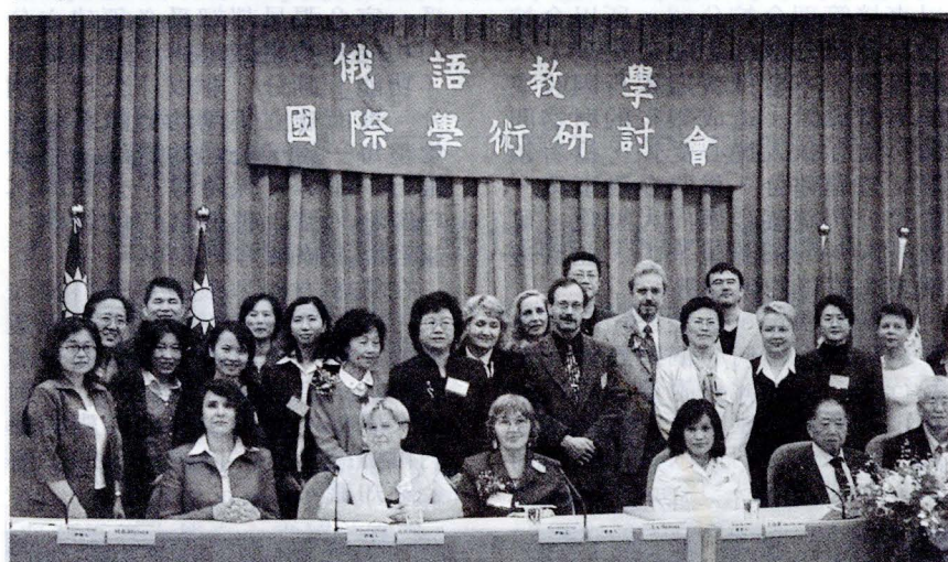
第 4 屆俄語教學國際學術研討會與會人士合影

【文 / 李細梅、高芊珊】文大俄國語文學系暨研究所於 4 月 24 日假曉峰紀念館國際會議廳舉辦「第 4 屆俄語教學國際學術研討會」，會中張鏡湖董事長親臨致詞。外交部曾慶源司長和莫斯科台北經濟文化協調委員會駐台北代表處韋哲康代表 Verchenko 以貴賓身份應邀出席致意。