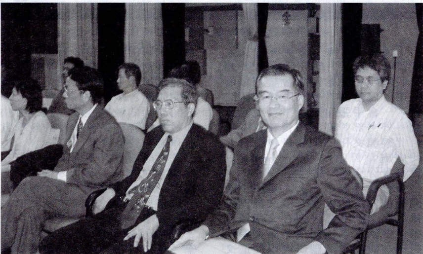
商學院週會邀請復華金控公司張昌邦董事長（右一）蒞臨演講，講題為「金融控股公司之經營與發展」。

在徵才方面，張昌邦董事長表示，金控公司需要多方面的專業金融人才，他鼓勵文大碩博班的同學加入富邦金控的行列，但對於大學部的同學，他則希望同學們再繼續進修，以更深入的了解金融知識。