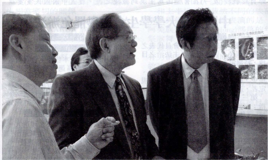
張董事長(右一)陪同楊博士(右二)參觀資訊中心。