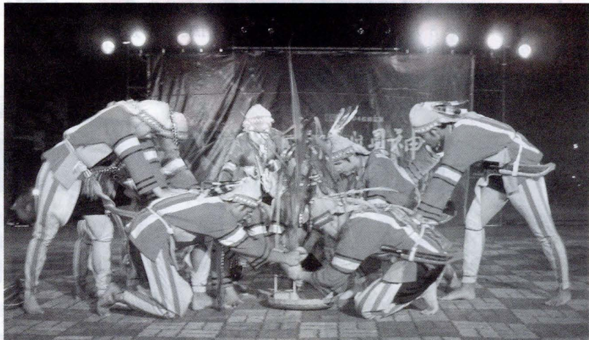
原舞者在百花池演出「太陽與貝神」，展現原住民傳統歌舞的真與美，撼動所有人的視覺與聽覺！

蘇團長談起這個古老故事，他說，由於當時洪水氾濫，使得一對兄妹為了傳宗接代，不得已結合。沒想到，生出來的小孩竟然都是爬蟲類。後來，太陽聽見這對兄妹的哭喊後，便答應施予祝福，但規定前幾個生出來的小孩，都要冠上太陽的姓氏才行。對現代人來說，這聽起來簡直就