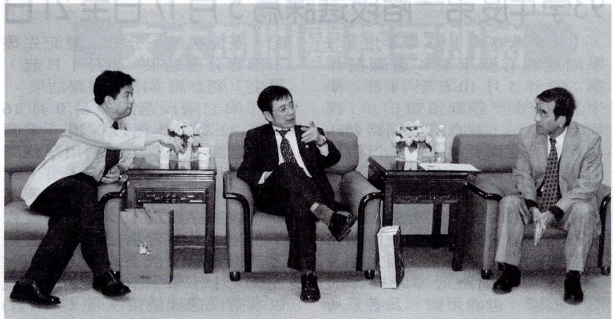
張俊彥校長(左二)於演講前特別與李校長(左一)及李豐明院長(右一)對話

【文/黃雅慧】工學院 28 日下午 3 點於大忠館華風堂舉行工學院週會，特別邀請到交通大學校長張俊彥蒞臨文大，於週會中為工學院師生演說「科技與詩的對話」。張俊彥校長首先與李天任校長及工學院李豐明院長會晤，隨後至華風堂為同學們展開一場「科技與詩的對話」。