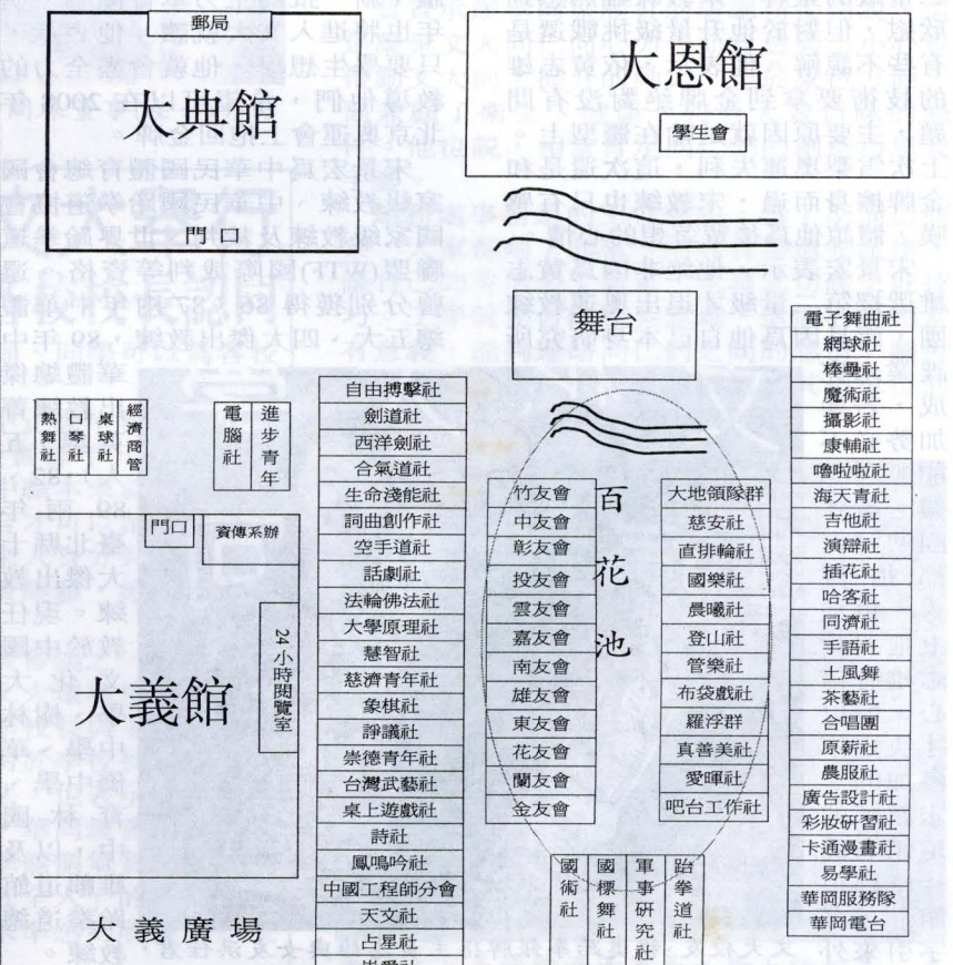
93 社團聯合招新攤位分配位置圖