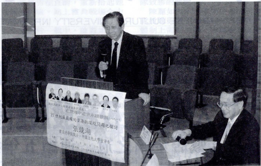
張董事長談 21 世紀世界最嚴峻的資源和環境問題，並與現場多位學者專家交換意見。

有關石油枯竭的問題，張董事長提到，1956年，修伯特(M. King Hubbert)提出一個理論認為油井開採後產量逐漸增加到儲