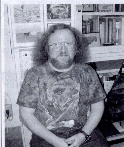
文大老師們都有著自己的看法與穿衣哲學。