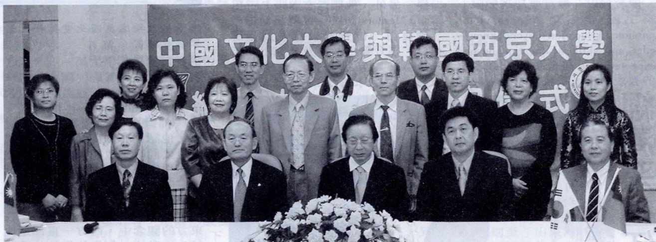
韓國西京大學與文大完成姊妹校簽約儀式,成為文大第 23 所韓國,也是第 69 所外國姊妹校。

【文/史庭璋】韓國西京大學 18 日與中國文化大學完成締結姊妹校簽約儀式,成為文大第二十三所韓國,也是第六十九所國外姊妹校。簽約儀式由文大董事長張鏡湖、校長李天任,以及西京大學校長韓哲洙分別代表兩校簽訂合約書。值得一提的是,文大是韓哲洙擔任西京大學校長以來,簽訂的第一所姊妹校。