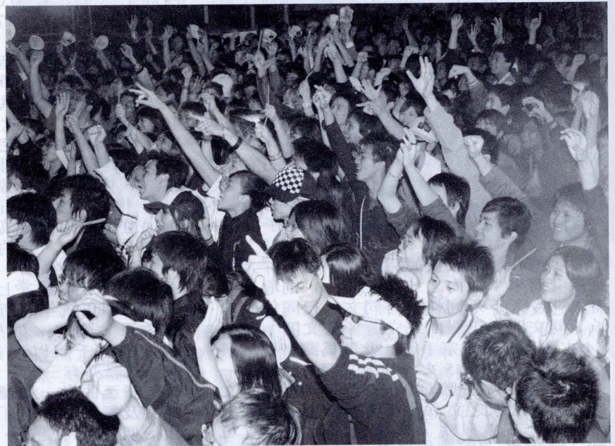
迎新晚會在近五千名同學的熱情呼喊聲中，劃下完美句點。

影文化城，安排好晚會所有的前置作業。為了持續凝聚華岡人的向心力，課外活動指導組表示，文大將於耶誕節、跨年時，舉辦更大型的活動，屆時歡迎華岡師生共同參與。