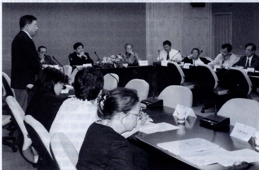
教育部「生物多樣性教學改進計畫」委員蒞校，了解本校計畫執行一年來之成果。

業人才，提供學生於原科系外，第二專長的整合性學程學習，以拓展學生在相關領域就業的學識基礎。成果更有編撰印行生物多樣性教材，如蕨類植物、蘭科植物、藥用植物、鳥類、兩棲爬蟲、蝶類、蛾類昆蟲解說手冊，大大提升教學效益。