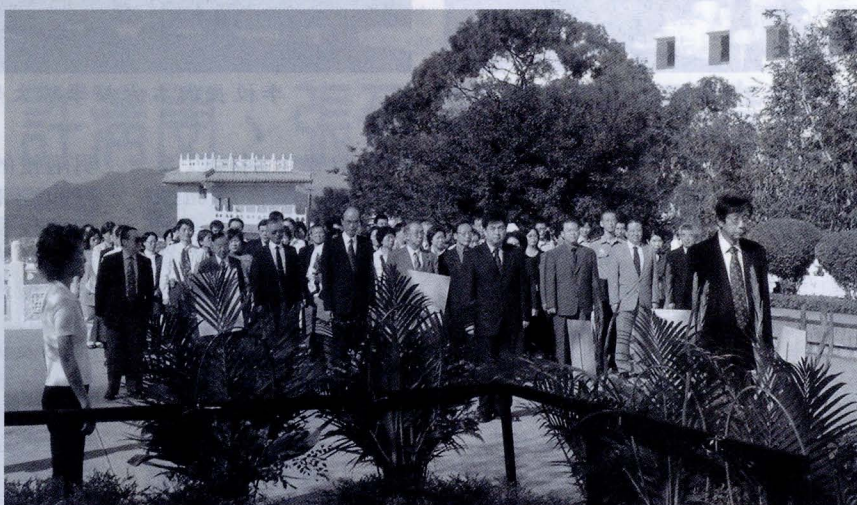
11月9日為創辦人張其昀先生 104 歲冥誕，本校師長們在董事長張鏡湖的帶領之下，在曉園舉行追思典禮。

民國 51 年秋，張創辦人排除萬難，創辦了中國文化研究所，也就是文大的前身，第二年大學部的 15 個學系奉准招生，遂改名為中國文化學院。民國 69 年升格為中國文化大學。張創辦人的創校理想，包括八大目標：國際性、整體性、文藝復興、學以致用、五育並重、華學基地、建教合作、高深研究；四種特色：東方與西方的綜合、人文與科學的綜合、藝術與思想的綜合、理論與實用的結合。今日文大教育