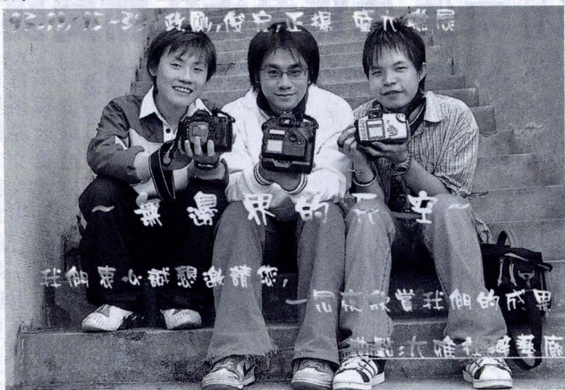
也許哪一天三個人已分道揚鑣，但是攝影將成為他們心中最值得花生命去做的事情。

三個天真的大男孩，帶著他們堅持夢想的單純想法，拍出許多令人嘆為觀止的作品。也許哪一天三人已分道揚鑣，攝影將成為他們心中最雋永、最值得花生命去做的事情。