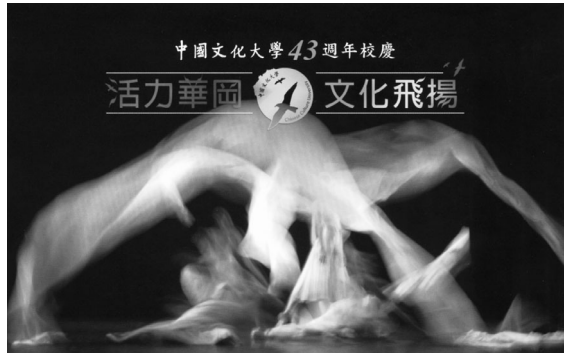
舞蹈系特別為四十三週年校慶獻上「活力華岡、文化飛揚」的舞蹈陣型。

今年校慶以「活力華岡、文化飛揚」為活動主題，包括在百花池廣場前舉行的愛心義賣園遊會、啦啦隊競賽、籃球賽、五項鐵人計時賽、海芋節等各項精采活動也正如如火如荼進行中。尤其在校園環境佈置上更加入不少巧思，特以海芋為空間設計主題，校慶也因此亦名為「海芋節」。校內各大重要景點包括百花池、仇人坡、菲華樓、華風堂則分別被規劃成「池畔花田」、「海芋喜迎賓」、「華岡成長故事展覽館」與「華岡心華岡情」共四大主題區。幻化成為海芋花田的百花池，兩側並設有造型氣球拱門，每位參與活動的人都獲持海芋花一束及印有校訓