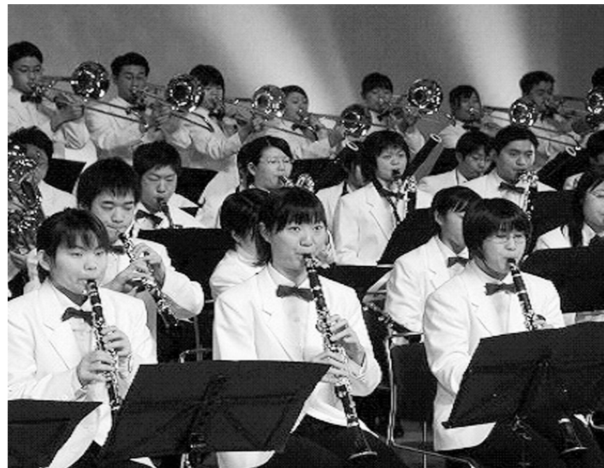
日本創價大學先鋒樂團演奏曲風寬廣，現今全國已擁有 120 名團員。

2001 年 10 月，連續 2 年參加全國大賽的比賽，榮獲金賞。同年 11 月，在頒贈創立者鮑林獎