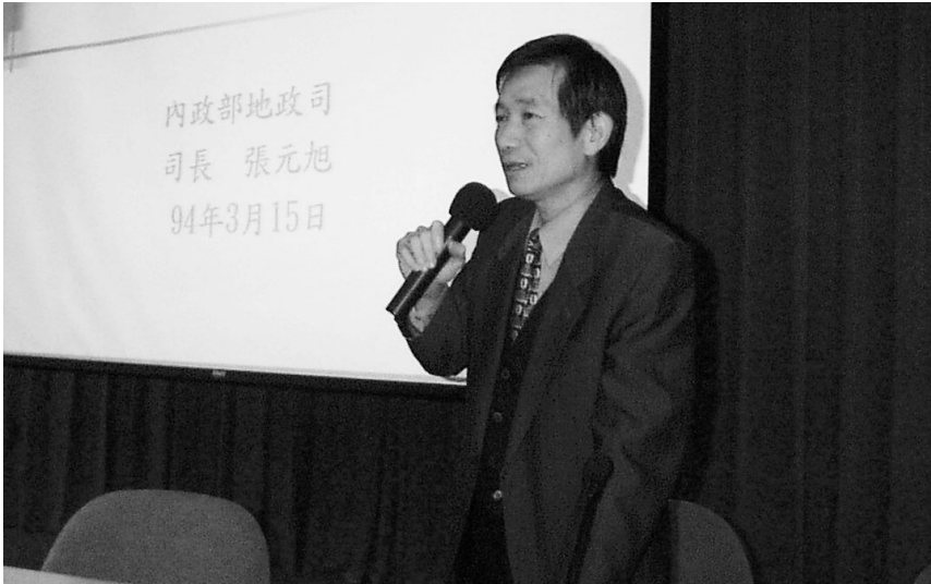
張元旭 15 日蒞校演講時指出，未來我國國土業務將朝完備測繪法制方向繼續努力。

「基本控制點檢測」、「基本圖測製」、「地籍圖重測」等三項工作展開執行，從此建立台灣地區測量製圖工作良好的基礎。迄今，國土測量業務已歷經 30 年的發展。 張司長表示，從民國 64 年以來，我國辦理的重要國土測繪業務，大致有「台灣地區土地測量計畫」、「台灣省圖解地籍圖數值化第一期計畫」、「應用全球定位系統實施台灣地區基本控制點測量計畫」、「國家基本測量控制點建立及應用計畫」、「台灣地區基本圖及地形圖修測計畫」、「台灣地區為登記土地地籍測量相關工作」等 6 項。值得一提的是，「台灣地區土地測量計畫」中的「地籍圖重測計畫」，從民國 78 年開始，將傳統圖解法測量全面改採數值法辦理重測，奠定了台灣地區地籍測量與地政業務現代化穩健的基礎。