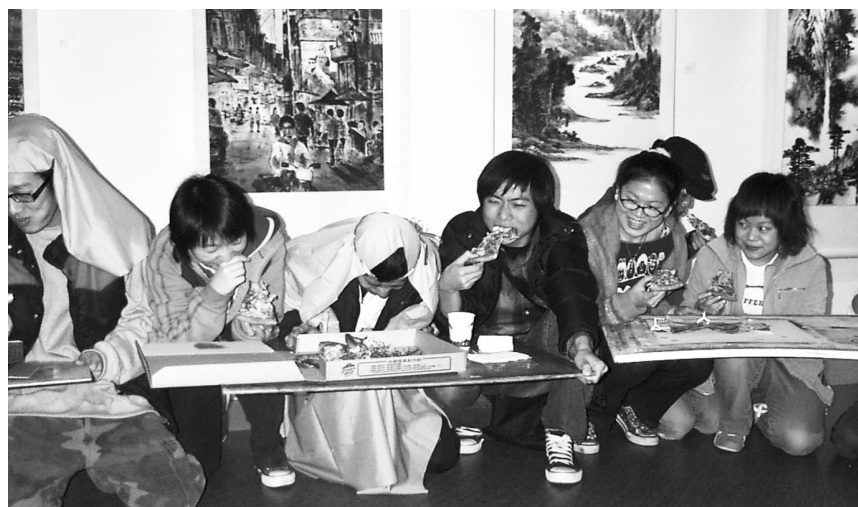
同學表演在台上猛吃 pizza 的橋段，模仿概念源自於達文西名畫《最後的晚餐》。