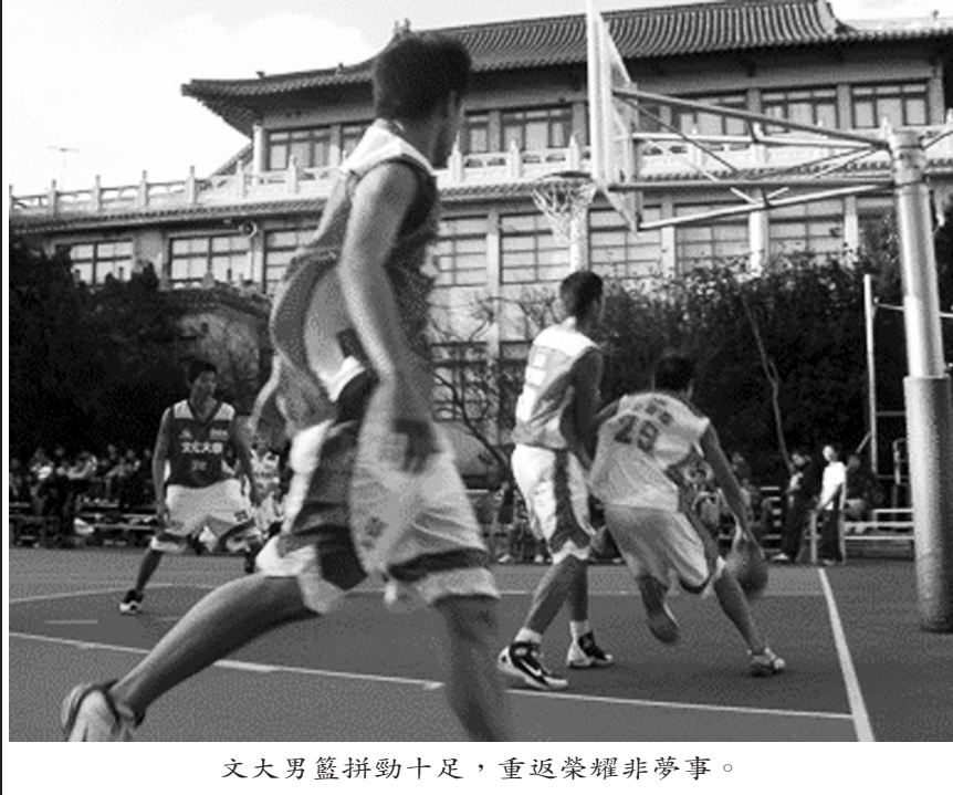
文大男籃拼鬥十足，重返榮耀非夢事。

在預賽所出列的八強實力都相當接近，這次球員能有這樣的表現，李教練笑著說：「其實不錯啦！」。雖然他也承認新進球員在高中時期的訓練不夠，生疏的球技是免不了，但未來表現絕對精采可期。