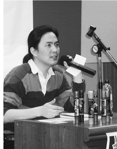
知名漫畫家阿推3月22日蒞校演講，鼓勵同學培養獨立與跳躍式思考的習慣。

【文／李文翰】國內知名中生代漫畫家、本名為姜振台的阿推，曾出版《九命人》、《新樂園》、《久命人》、《巴力人》、《殺人負責權》等漫畫作品，並以Push Comic System延伸漫畫精神，以科幻為原點向外放射，涉足電影、音樂、流行、攝影、設計、文字等創作領域。他於3月22日下午接受廣告系之邀，蒞校假大恩館國際會議廳，與同學共同揮灑「創意的極限」。