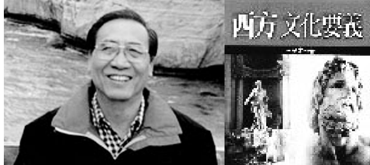
王曾才教授的《西方文化要義》一書，平實介紹西方的文化與歷史淵源。

王曾才教授著作等身，Trandition and Change in China's Management of Foreign Affairs、《清季外交史論》、《中英外交史論集》、《西洋現代史》、《西洋近世史》、《世界近代史》、《世界現代史》、《世界通史》、《中國外交史要義》、《加拿大通史》、《平凡說從頭》等書，中英文合計高達 500 萬字。