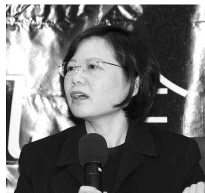
立委蔡英文 3 月 24 日與文大學生針對「台灣奠基、接軌全球」母題，進行多方子題的思索與探討。

【文／陳彥琳】現任立委蔡英文女士於 3 月 24 日上午，應政治系學會及台灣進步青年社之邀，與文大學生暢談「全球化下的兩岸關係」。此系列演講活動由「社團法人台灣青年智庫」所主辦，進行文大、世新、東吳及師大等大學巡迴講座，希望藉由「台灣奠基、接軌全球」的母題，來進行多方子題的探討，進而在面對全球化趨勢下競爭與挑戰的同時，思索如何深耕台灣、迎向全球。