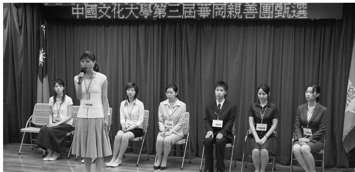
圖為文大親善團甄選，參賽同學積極展現才藝演說能力。

歷經一整天淘汰廝殺賽後，會後評審老師交換意見，獲選名單出爐，共有 66 名同學入選文大親善團員，下學年度新訓練即將展開，當選名單同步公布於總務處公關室外佈告欄。