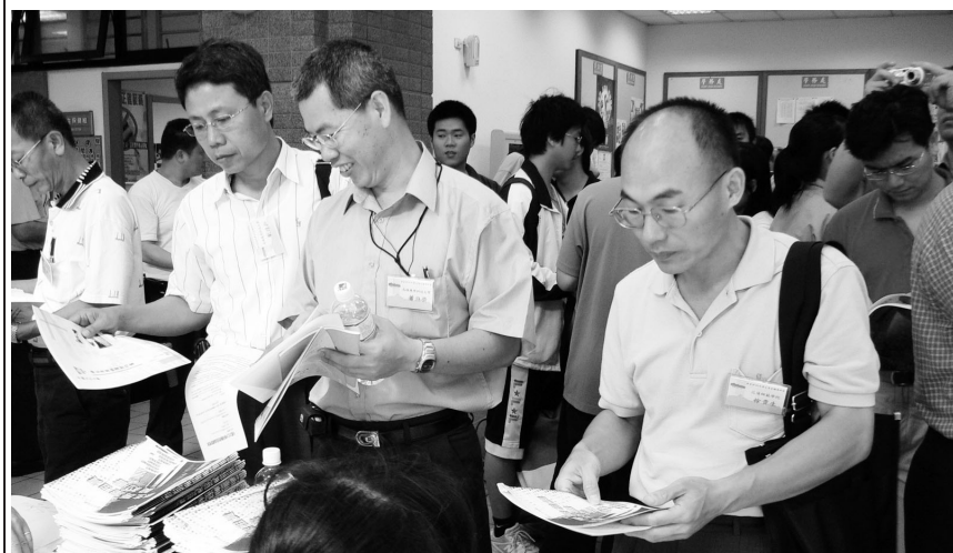
學生賃居輔導研習活動學員蒞校參觀租屋博覽會資訊展，檢視文大完善租屋設備。

假大恩館川堂的租屋博覽會相關資訊展，學員們對於本校租屋設備完善感到開心，在了解相關資訊後，博覽會現場更舉行有獎徵答，讓每位學員抱得大獎、開心賦歸。