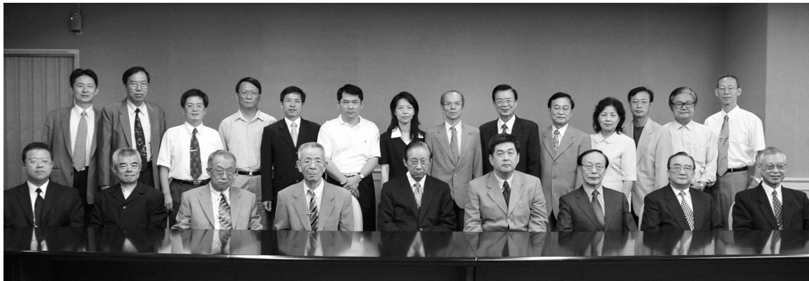
新學期新氣象 新任一級主管開始為文大衝鋒陷陣

【文 / 劉芳汝】歡迎新任一級主管及專任教師群加入華岡大家庭裡，今年自暑假過後陸續召開大型行政主管會議，及新舊主管交接儀式，為照顧學生福祉於 9 月 7 日舉辦開學前的行政會議。李天任校長強調，今年的新生報到率達到九成以上，成績亮眼，這是好消息，也是學校一級主管及新任教職員的重責大任，希望齊勉為華岡一起加油努力。