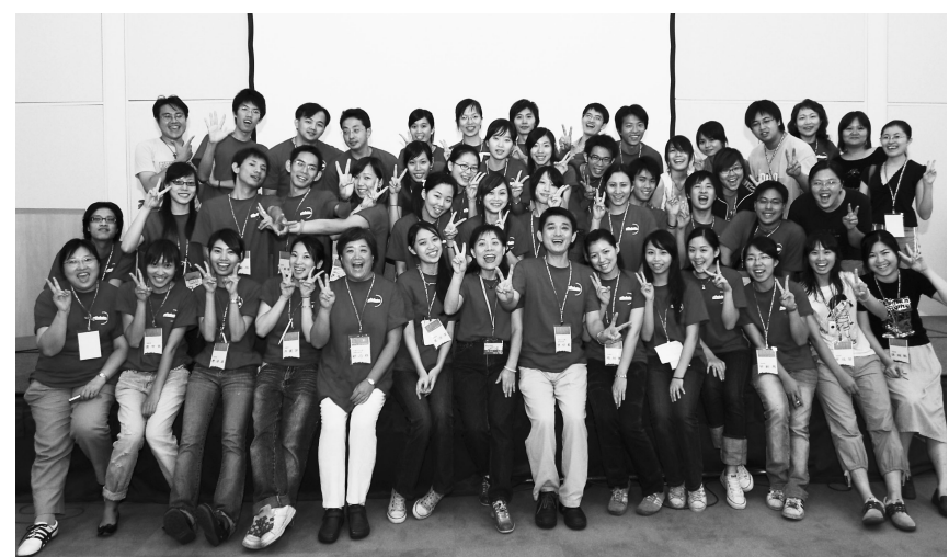
「紅衣小天使」的親善團 成為青年國是會議最搶眼的服務隊