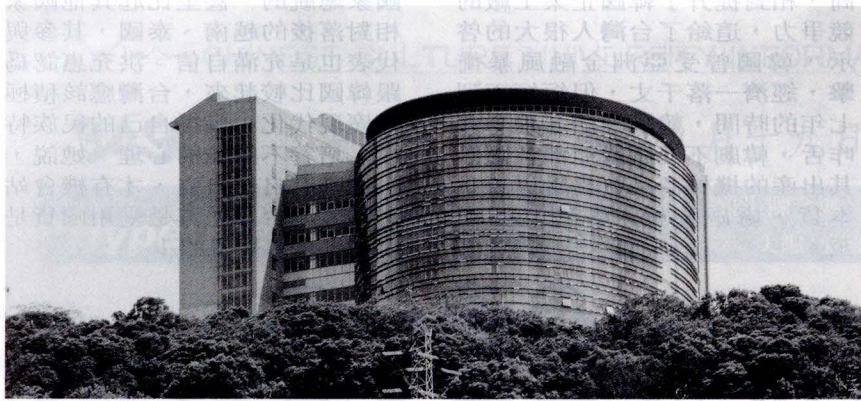
文大藍色巨蛋將耀目登場 請拭目以待