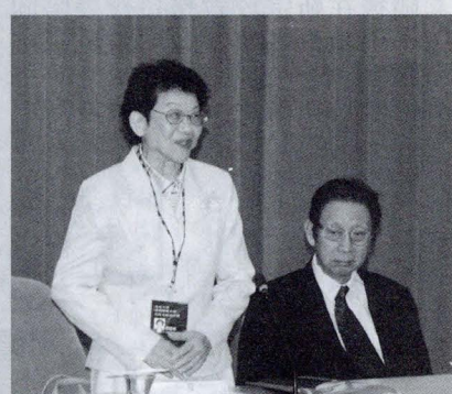
賈會長以「筷子」之喻，形容突飛猛進的中國大陸

賈會長介紹北京大學的歷史時，連帶指出北大奮鬥的目標——成爲世界一流的大學，並培育更多頂尖的學者成爲頂尖學者的搖籃。緊接著會長又以「創新」爲現今大陸發展創新型國家及人才培養，最爲急迫的改革階段，因爲有新的技術才有新的專利，而新的專利才可以創造更高的價值，這一番話等同於告訴在