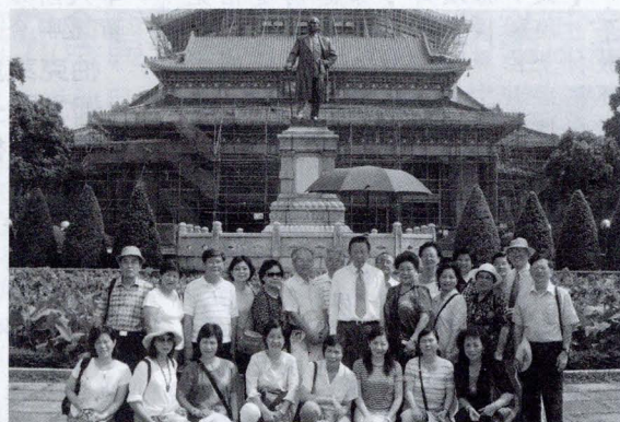
廣州中山紀念堂合影

上午 11 時趕往位於麓湖路 13 號的「廣州藝術博物館」(GUANGZHOU MUSEUM of