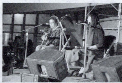
自然捲娃娃(右)獨特嗓音，在與吉他手奇哥一搭一唱下，現場笑聲不斷。

心活動，除預購「自然捲」未上市的簽名 CD 限量 50 張之外，「蘇打綠」更於現場簽名、募款，為慈善演出畫下完美的句點。