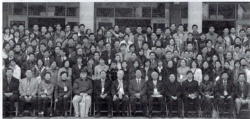
「華人運動生理及體適能學者學會年會暨學術研討會」與會成員合照

2006大運會公開向全國學生甄求主題曲。讓「選手之夜」除了有知名歌手代言以外，同時結合學生的精采表演。提供有志青年學子展現豐富情感與創造能力的一座新舞台，啟發社會向上提升