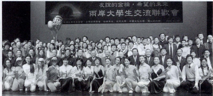
北京大學藝術團與文大華岡舞蹈團熱情舞蹈，為兩岸藝術交流寫下美麗紀錄。

本校華岡舞蹈團融合現代舞、芭蕾舞與中國舞蹈，以一曲「阿美族豐年祭」歌舞，及「觸動」現代舞碼，讓觀眾在體驗傳統原住民的熱情風格外，還能感受現代舞曲的新生命力。