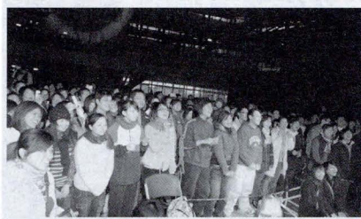
大傳學系辦首場體育館演唱會吸引愛好搖滾的同學參加，音樂人愛心不落人後。

名曲《頻率》，讓團員忘情跳下台與同學們握手，而台下的同學們則紛紛越過封鎖線往台前移動，震撼在場每個人的心。