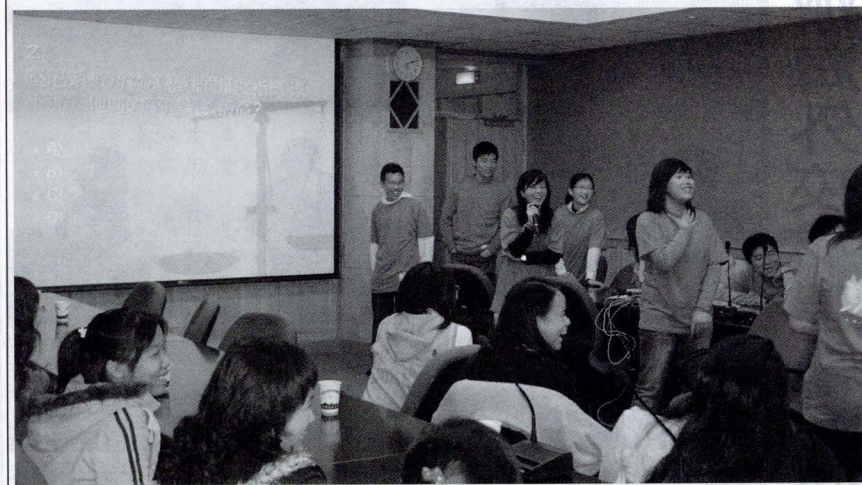
香港與台灣學子互動熱情，為港台交流寫下難忘回憶。

此外，東華書院的學生準備互動遊戲，讓到場的社福系同學能夠毫無拘束的做「Q&A」活動，熱絡彼此之間情誼，雖然東華書院一行人只到台灣 4 天 3 夜，但參訪費用全是學生們自費來到台灣，而透過師生互動聯繫感情，增添一番教學樂趣，賓主盡歡，留下難忘的回憶。