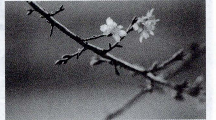
冬至甫過，華岡的櫻花悄悄爬上枝頭，您看到了什麼！

投稿陸續徵文中歡迎同學們可用各種創意呈現作品，並繳至總務處公共關係室(大恩館 2 樓)或是直接 E-mail 至 editor@staff.pc-cu.edu.tw