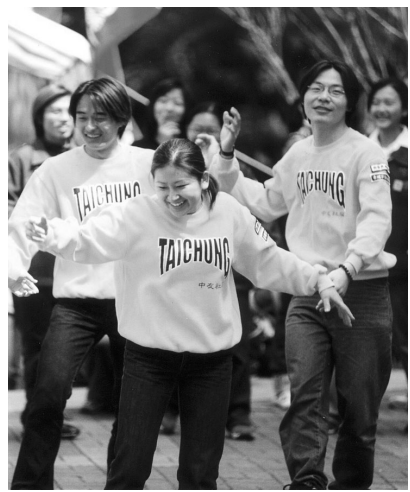
活潑的社團生活 豐盛校園新聞

不敢來挑戰!802記者開啓校園精彩世界心路歷程大公開〉、〈全國大專優秀青年校內遴選出爐15位菁英逐鹿大專優秀青年之列〉、〈花招百出作弊法 獎懲會一把公平尺為你主持公道〉、〈四十三週年校慶慶祝大會華風堂舉行〉等等新聞都創下上千次瀏覽紀錄。