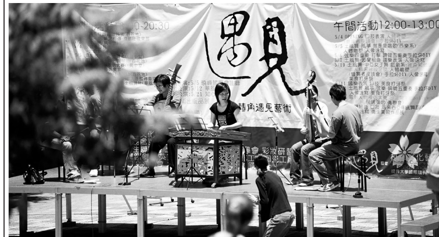
活潑服務至上的華岡青年,為文大社團寫下一頁精彩故事。