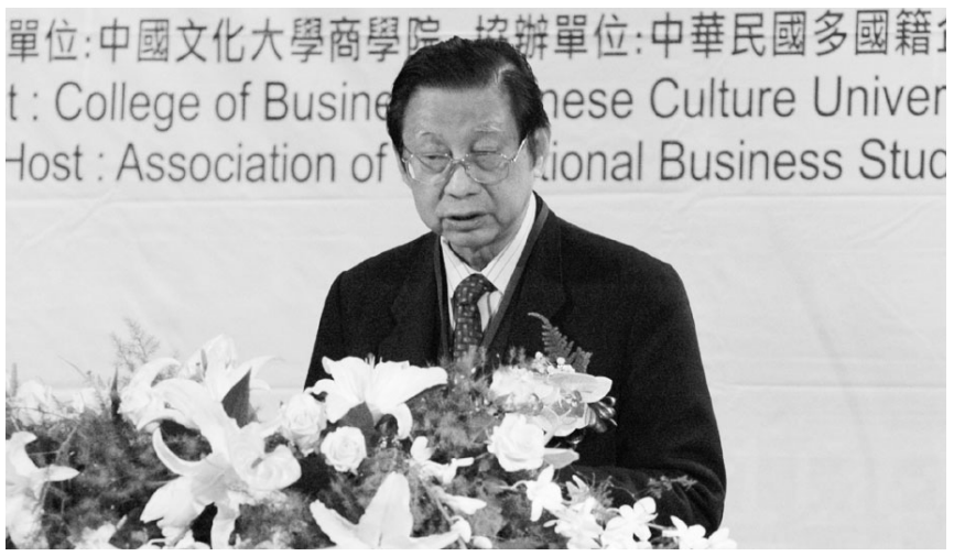
單位：中國文化大學商學院、協辦單位：中華民國多國籍企業國際學術研討會、主辦單位：College of Business Administration, Chinese Culture University、Host: Association of International Business Studies

張董事長以三個論述，期許作為國家政府以及國際投資代理機構為獲得外來直接投資效益所採取任何行動的指引。第一雖然外來直接投資可幫助國家在全球化時獲益並協助經濟發展，但不可以將其視為解決經濟問題的萬用藥。張董事長認為，「創新的願景、重要機構的建立、以及文化認同和信仰體系對這國家是非常重要的」。其次，政策制定者需要從過去成功及失敗的經驗學習，需要學習相類似的國家的發展經驗，但不應受制於這些成功、失敗及經驗。第三點則為鑑於外國直接投資對經濟發展貢獻的認知，以及對全球人類環境論點的改變，國