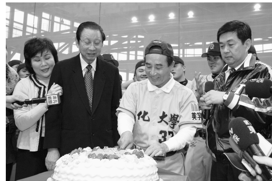
張董事長（左二）、穆岡珠董事（左一）李校長贈送大蛋糕為王院長暖壽。