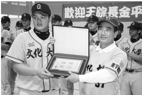
王院長感謝文大盡心奉獻體育棒壇教育，特致送獎牌予本校，由本校體育系同學受獎。

【文 / 林雅琪】國會殿堂領袖王金平院長以一襲中國文化大學運動勁裝現身文大！為感謝去年本校美孚球隊協助拍攝宣傳短片，王院長 16 日蒞臨文大訪問。16 日為王院長生日前夕，張董事長及李校長貼心準備一個大型生日蛋糕及美孚球隊的「戰舞」表演，為王院長提前慶生。不少同學亦慕名而來，齊為王院長合唱「生日快樂」！溫馨熱情，讓王院長在被一群美孚棒球球員簇擁拋上空中時還笑說，「感謝華岡人的心意！」