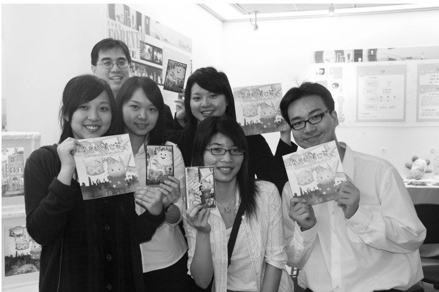
資傳系大四同學創新求變的展示畢業展成果，為四年大學生涯留下難忘一頁。

過程均是難得的經驗，建議應留下每一步走過之路，為現今還是大三及大二的同學鋪路，讓學弟妹們明確的知道未來的路是什麼，也能讓這樣的畢業影響持續延燒擴大，展現另類「傳承」經驗。