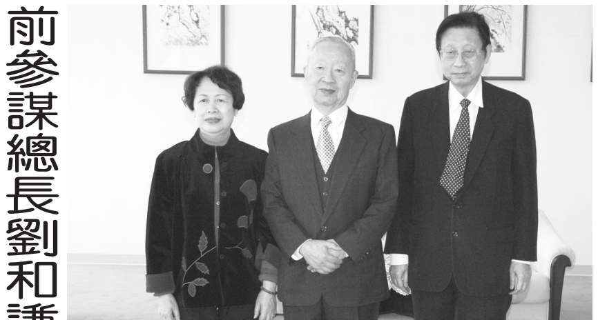
張董事長與前參謀總長劉和謙上將伉儷合影。

林所長強調，此次行程意義非凡，不但開啓國內「學術外交」嶄新一頁，還讓中韓文化交流更上一層樓！