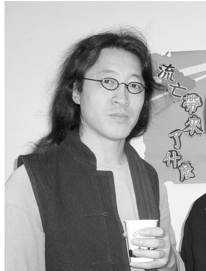
貝嶺的流浪藝術風格，爲文大掀起另股文藝風。

【文／侯偉琪】15日下午，文藝系邀請到響譽國際的大陸詩人一貝嶺蒞校演講，瀟灑的風采自他的衣著中顯露無疑，與本校古樸建築物相映輝照，爲文大帶來另一股文藝風！