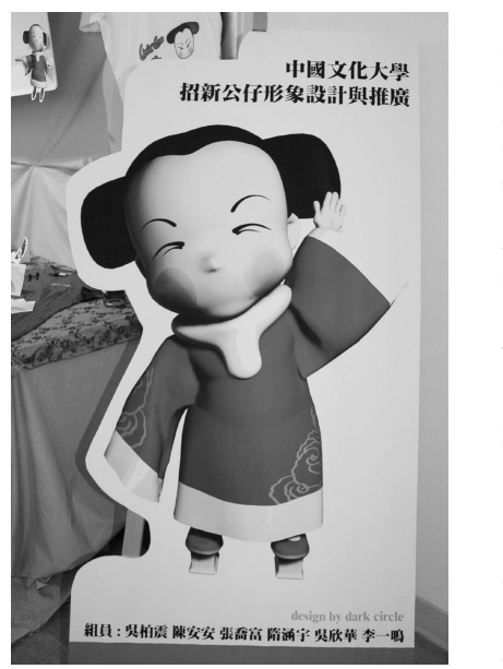
「招生格格」鳳眼，搭配火紅熱情小棉襖，校園吹起公仔風。

文大「格格」梳著兩個雙髻，圓圓的臉蛋上掛著清秀的柳月眉，象徵古典美女鳳眼靈秀之特質，熱情火紅的小棉襖，足蹬三寸金蓮，融合文大典雅特色的娃娃，化身文大招生公仔，掀起校園公仔熱。一系列的創意作品，展現 e 世代的活力。