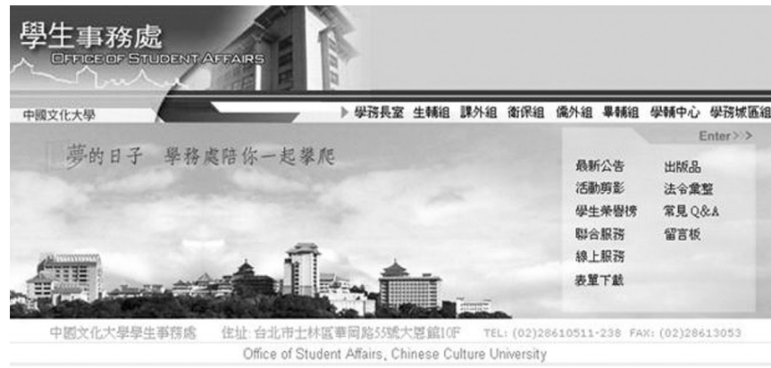
中國文化大學學生事務處 Office of Student Affairs, Chinese Culture University

競賽」，自今年1月開始到現在已歷3個月，在這段時間裡，全校各學術、行政單位莫不積極招兵買馬，投注心力於網站的設計中。為換取更多元的建議，資訊中心特別推出網路票選活動，歡迎全體師生同仁，來提供寶貴意見，不吝給表現優質的單位掌聲，讓追求卓越的熱情能持續燃燒。