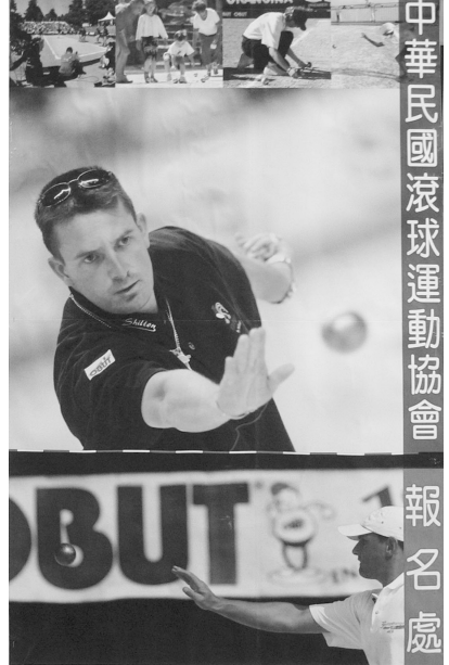
中華民國滾球運動協會 報名處