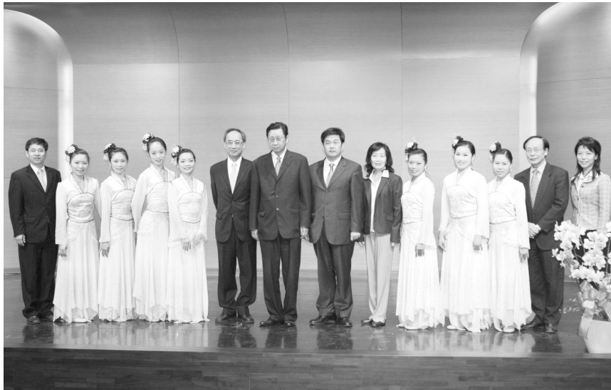
頂級演藝中心將成為國際研討會及演藝表演重鎮。張董事長、李校長及校內師長與舞蹈系表演同學合影。

【文／楊玲】文大體育館 8 樓「柏英演藝中心」正式啓用！首創融合座椅、音響設備 7 吋 LCD 的椅背設計，共計 393 席，全廳共計 435 席座位，未來將作為各種視訊及語文測驗專用，成為國內首座具有專屬測驗功能椅座的會議廳，引領全國各大專院校。