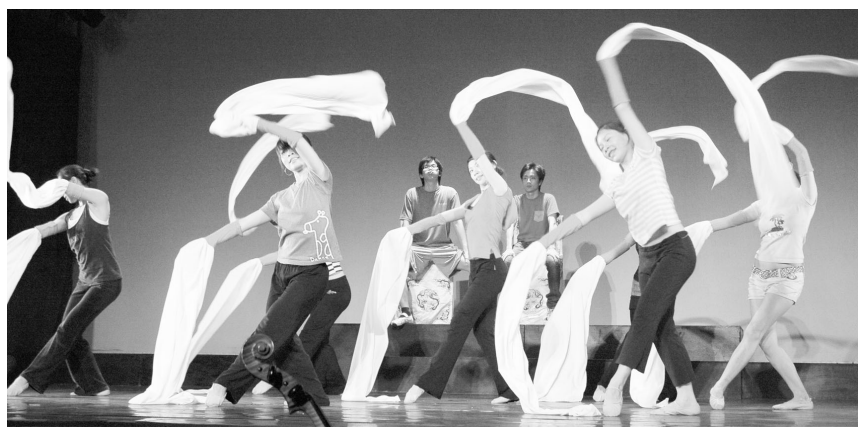
少年傳奇融合新式彩帶，舞出現代與傳統之爭議

一直沒有屬於自己的校園演唱會，繼在去年舉辦的「MOS聖誕舞會」成功之後，配合體育館落成，各系所的系學會長就開始計畫這次的活動，希望藉由「無菸月」及「無菸週」舉辦演唱會，