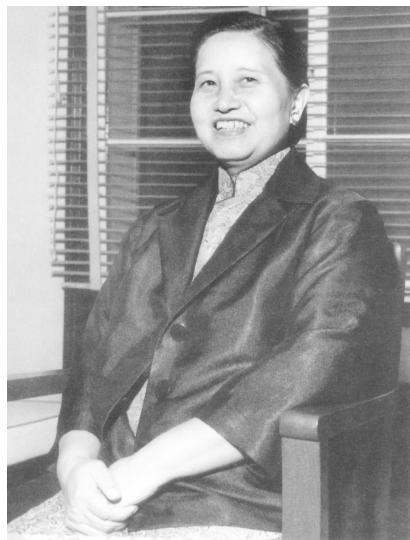
龔太太夫人五十八歲留影