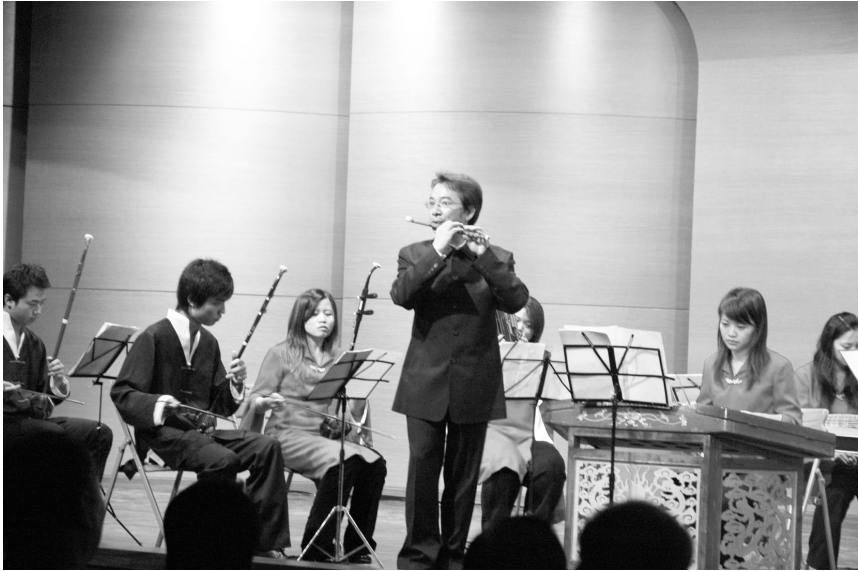
華岡絲竹樂團以「揚州小調」為柏英演藝中心開幕演奏

特別的是，領先全國各大專院校，提供國際級的語言測驗考場所。該設計風格為現代化產學合作新模式，由本校與承包廠商共同研發出結合座椅、音響設備的 7 吋 LCD 椅背設計，全都可作為視訊及語文測驗使用。