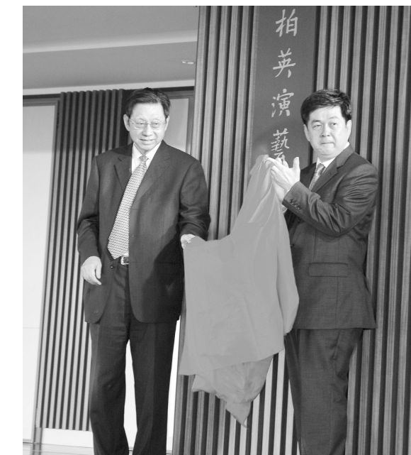
張董事長與李校長聯合為柏英演藝中心揭牌