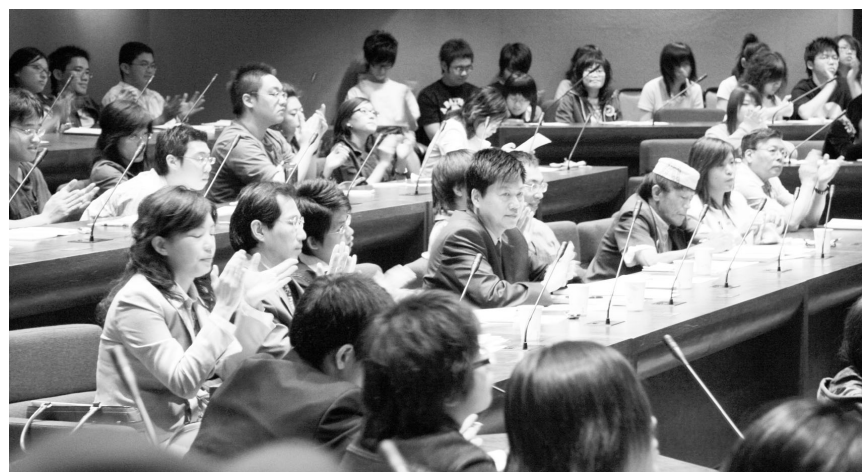
「廣電暨新興媒體寫作的理論與實務」研討會，廣邀產、學界媒體菁英齊聚暢談媒體亂象及推動未來媒體改革大計。

【文 / 童意伶】本校大眾傳播學系有感於新聞寫作不符當前廣電暨新聞媒體需求，5月20日與中央通訊社及中華民國傳播教育協會聯合主辦「廣電暨新興媒體寫作的理論與實務」研討會，廣邀產、學界媒體菁英齊聚暢談媒體亂象及推動未來媒體改革大計，包括東森、TVBS 及大愛電視台均列席參加。