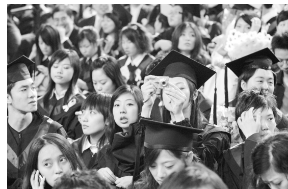
畢業生忙給自己拍下歷史畢業鏡頭。

課指組也貼心在大成館外安排「階梯照相區」，讓每一個畢業生及其家長都可以在大成館外照相留影，使美麗的華岡倩影深印在每一個華岡人心裡。