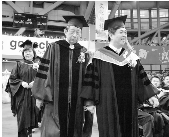
張董事長、穆董事及李校長走過畢業盛會紅地毯，為畢業生獻上最美祝福。

【文 / 呂祥竹、陳昱祺、林雅琪】第 44 屆畢業典禮 9 日於體育館溫馨登場，今年除首度於體育館舉行外，還特別鋪設畢業盛會紅地毯，由親善團引導張董事長、各位董事、李校長、各學院院長及畢業生們走過紅地毯，象徵寫下最火紅熱情的畢業盛會，其花絮剪輯之精彩動人，有典禮 Live 直播、校園巡禮、畢業花海以及曼妙會場樂音，讓典禮增色而繽紛。