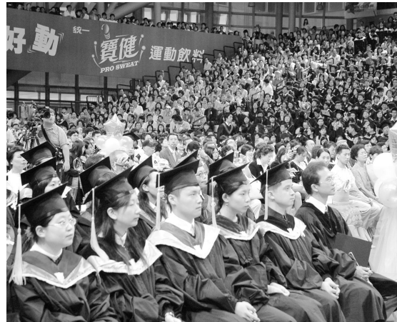
創校以來首度於體育館舉辦的 94 學年度畢業典禮，群聚華岡菁英，展翼未來。