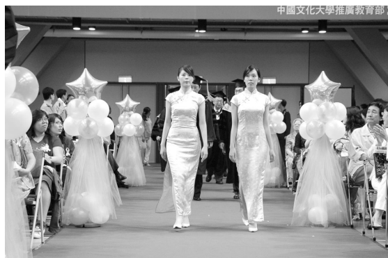
為畢業生鋪設的畢業紅地毯之路，留給師生特別的印像。

今天與去年最大的不同在於，文大畢業學生可以在這台北市陽明山上的重要地標大孝館中舉行畢業典禮，在這大孝館中，今年畢業典禮容納畢業生及家長共計萬人，更顯示