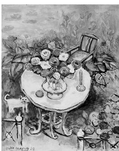
何和明教授的池畔花桌寫實展現園藝與自然之美

【文 / 呂祥竹】擅以印象派表現風格為其特色的何和明教授，6 月 19 日起至 6 月 30 日於文大華岡博物館舉辦「花漾年華」作品展。本次展覽以花卉為主題，間以人物展畫，構圖簡潔而巧妙，用色大膽而不失樸雅，筆調細緻，似浪漫似寫實，如詩如夢，頗有前後印象主義之風貌。何教授繪畫素材，常見鮮花與水