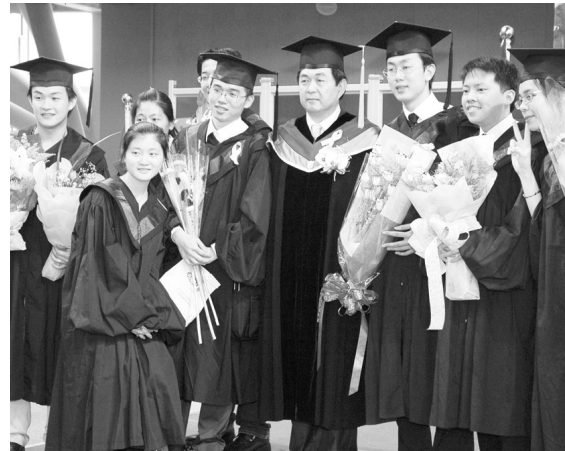
李校長熱情與華岡畢業生合影留念

站內的所有資料未來也都會轉以「網路同學會」的方式呈現，讓這些值得紀念與珍藏的記憶可以永久保存。