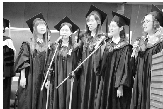
華岡合唱團獻唱校歌，清亮歌聲，留給畢業生滿滿祝福。

文大資訊中心特別設置網站，提供畢業典禮相關行程與各種紀念性的網頁。除特別製作了文大 12 個學院院長對於畢業生的感言與期許，也包括畢業生以及在校生的祝福語。還有電子畢業賀卡製作、網路畢業紀念冊、心情傳真留言板、榮譽榜、畢業相關新聞以及校園巡禮等。另外，畢業典禮專屬網