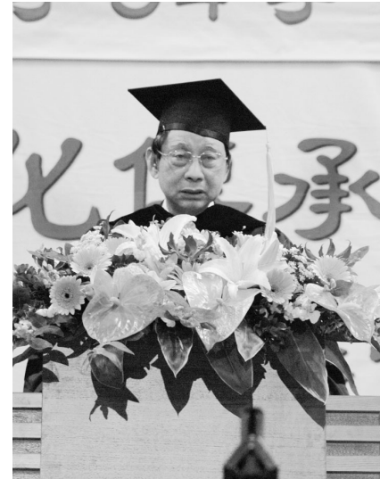
張董事長以「質、樸、堅、毅」期望畢業生展翼華岡，邁向未來。