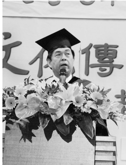
李校長以「凡耕耘者，必有收穫」期待畢業生成為社會菁英。